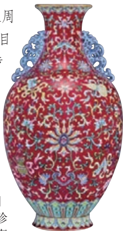
■乾隆 洋彩胭脂紫地暗八仙雙鳳耳瓶

蘇富比中國藝術珍品還包括「悅悅滿園·貝氏情色藝術珍藏」及「德安堂藏玉」。貝素烈藏秘戲繪畫及工藝品，展覽、出版甚豐，其中蘆葦齋舊存康熙御製《悅悅滿園》冊八頁，鑄鑄鑄鑄，卻不顯俗韻，耐人尋味。德安堂藏玉，瓊瑛琳琅，首推乾隆和闐青玉寒山聽雪圖山子，陰刻填金御製詩六首，烘托迭翠疊峰之磅礴。還有高福履舊藏明代黃玉駱駝，尺寸碩大，雕琢生動。