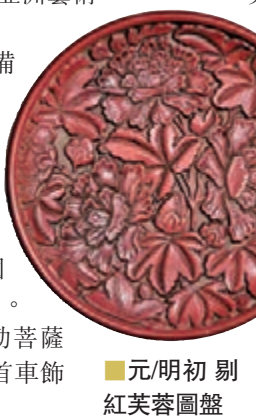
■元/明初 剔紅芙蓉圖盤

佳士得「重要中國瓷器及工藝精品」專場351件拍品，294件成功售出，最重要的高古瓷、明清官窯、古董傢俱均已名花有主，成交率近84%，斬獲逾2億4267萬元，表現勝於拍前預期。