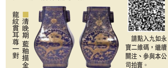
■清晚期藍釉描金龍紋寶耳尊一對

還有，清光緒粉彩龍鳳紋荸薺瓶。大清光緒年製款，高33cm，品相良好，來源於文物商店舊藏，起拍價7萬4千元。此瓶直口，長頸，溜肩，球形腹，圈足。胎體厚重堅實，釉色肥腴瑩亮。口沿下飾一周粉彩如意雲頭紋，頸部繪蝙蝠紋，紋飾細膩，色彩豔麗，裝飾效果極為強烈。肩部飾金彩弦紋，內繪連壽壽字紋，腹部主體紋飾為祥雲龍鳳，施彩明豔，筆法流暢，寓意龍鳳呈祥。近足處飾仰蓮紋，為光緒朝官窯瓷二品。