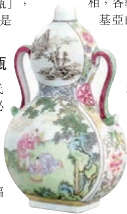
■乾隆 珐瑯彩庭園嬰戲圖 綵帶耳葫蘆扁瓶

高古青銅重器匯集紐約蘇富比 紐約亞洲藝術周蘇富比首場中國古董專拍「藝萃流芳·吳權博士藏珍」，白手套贏得開門紅，140件瓷器、玉雕、青銅及書畫等，100%成交。該場開拍首件器物是西周青銅簋的蓋子，嚴格來說只能算半件器物，估價不高，但因為北宋宮廷舊藏，一路競價到207萬元成交，足足溢價40多倍。吳博士釋出的其他收藏品也拍出高價，如：乾隆青玉雕雙龍戲珠巴薩尊者山子、南宋安陽得方彝，分別以838萬元及690萬元成交。吳權的藏品不少來自名家舊藏，如大維德爵士、「放山居主人」莫里森等。 「中國藝術珍品」專場，一批高古重要青銅器齊集於此，重中之重焦點為「西周號季氏子組壺」，此壺清代陝西鳳翔出土，先後為清末幾任藏家珍藏，身世無比顯赫。號季氏子組壺不負眾望，以1652萬元成交，物超所值。同場的明清瓷部分也相當精彩，青花部分，一件與中國淵源頗深的美國私人家族秘藏的「宣德青花雲龍紋大鉢」最為精彩，紋飾優雅精緻，刻畫雙龍矯健雄壯，乃屬宣德青花珍品，以986萬元易手。另有一件「乾隆青花折枝花果紋大梅瓶」也以661萬元成交。 「中國藝術珍品」專場上拍一組高級別隋白瓷及唐三彩，約有40件高古瓷，規模不小，品質優秀，吸引一眾買家競爭，成交不俗。引人矚目的一對高115.6cm唐三彩鎮墓獸體形高大造型奇特，人面獸身造型挺胸蹲坐於台座上。闊口獠牙外突，凸睛豎眉，虎視眈眈，面容威嚴。頭部兩側生扇形肥大的雙耳，頭頂生尖形高角，附小支角。雙肩生翅，左右各二。足呈牛蹄，尾巴盤在四肢當中，背部塑四短狀鋸齒形脊飾。身施以黃、褐、綠三色釉，頭面部及前足未施釉。這對三彩鎮墓獸經一番爭奪，以168萬元落槌。 紐約蘇富比網上專拍「博古五千」，集合近200件中國藝術品，同樣有好的表現。