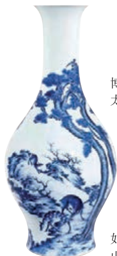
■乾隆 青花松石壽鹿圖橄欖瓶

春拍在即，蘇富比將率先展開兩場網上拍賣，分別為4月6日至19日的「劃時代的鐘錶巨匠：傑洛·尊達珍藏」，以及4月12日至5月5日的「WWF Tiger Trail 2022」。