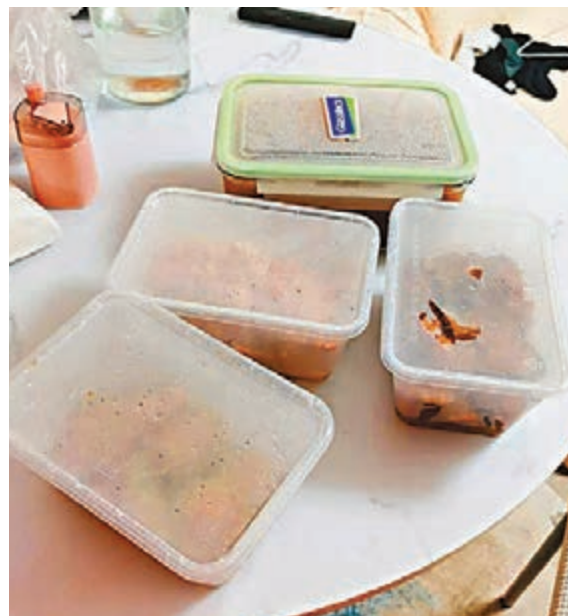
▲嚴太為確診家庭下廚烹調「三饅一湯」，希望他們有充足營養恢復健康。