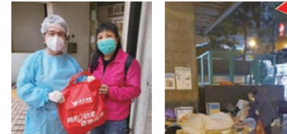
該會婦女委員會義工自資購買防疫物資予行動不便的長者。