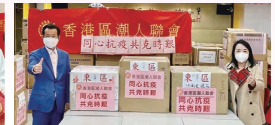
香港區潮人聯會分派防疫物資予東區幹事會、南區幹事會、灣仔區幹事會、中西區幹事會和八個部。