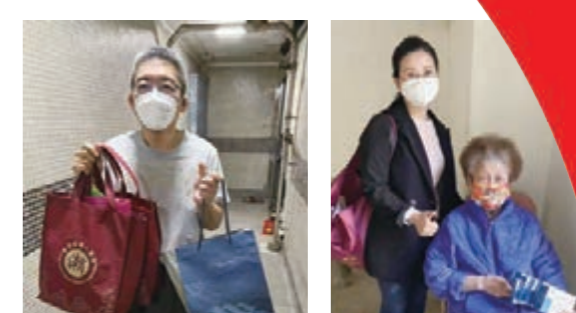
該會青年委員會義工派發防疫物資予確診義工及會員。