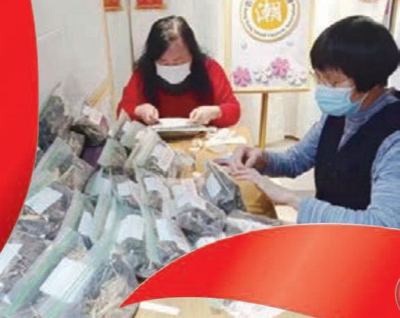
該會東區幹事會義工包裝執證中醫藥藥包給有需要人士。

香港第五波新冠肺炎疫情嚴峻。香港區潮人聯會在會長胡池帶領下，迅速組成緊急防疫義工隊，連續協助包裝防疫物資，分派香港區潮人聯會屬下的四區幹事會和八個部，將防疫物資轉給有需要的義工和會員，特別是初診和確診的義工，並協助在防疫中遇到各種困難的鄉親會員，發揮守望相助的精神，給予潮人義工會員信心和力量。 香港區潮人聯會收到求助的確診義工有60多人，組織防疫慰問隊密切跟進，及時上門派發防疫物資，使確診義工得到及時的藥物治療。義工們對該會的關心支持，衷心表示感謝。