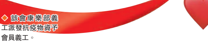
該會康樂部義工派發防疫物資予會員義工。