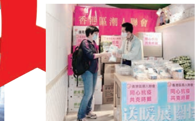
該會南區幹事會義工派發防疫物資予確診義工及會員。