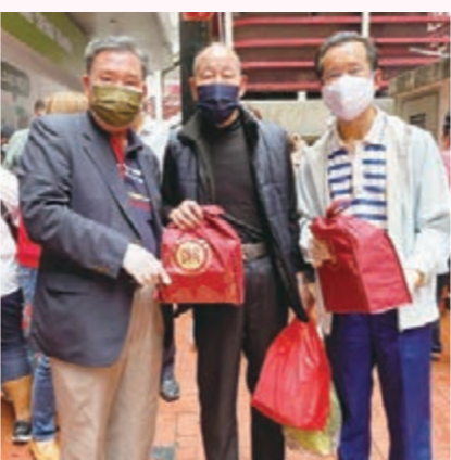
香港工聯會會長、立法會議員吳秋北(左二)和香港區潮人聯會會長胡池(左一)向街坊派發物資。

長者群體是香港第五波疫情下的重點保護對象，香港區潮人聯會也致力在港島各地區前線服務長者會員、街坊，為長者提供更多的關愛和防疫物資幫助。 3月26日，香港工聯會主辦，香港潮屬社團總會和香港區潮人聯會贊助「同心齊抗疫 社區支援計劃」防疫物資派發活動。香港工聯會會長、立法會議員吳秋北、立法會議員郭偉強、香港區潮人聯會會長胡池、監事長張仲哲、會長候選人吳家榮、副會長兼秘書長林其龍，以及常務副會長兼東區幹事長馬金美等，齊為北角區的長者會員、街坊市民派發防疫防疫物資。 當日活動共向街坊市民派發500份防疫包，共計口罩10000個、兒童口罩25000個、伏爾劑2000劑、劑助劑1000盒，幫助大眾減低染疫的風險，提高對身體健康和生命安全的保障。