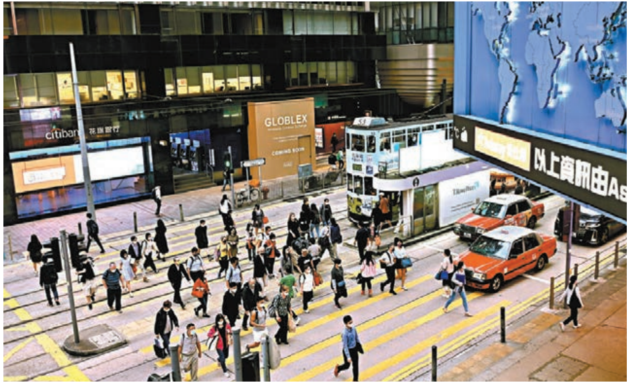
◆林鄭月娥昨日表示，能與內地恢復正常通關是香港吸引外資的重要因素，即使香港能與外國正常通關，但若不能與內地免檢疫往來，也將大大打擊外資來港發展的意慾。圖為中環鬧市。

她又指，政府另外推出了「2022保就業」計劃，正正聚焦支援中小企。在金融領域，特區政府則不會支援大公司太多，但少於50名僱員的小型企業，會全數補貼其工資。