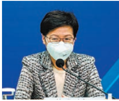
◆林鄭月娥昨日表示，香港的抗疫政策絕不能「躺平」。

林鄭月娥昨日與財經事務及庫務局局長許正宇出席抗擊記者會，回應有聲音關注嚴格的防疫措施會否影響香港的競爭力。林鄭月娥表示，從沒忽視香港作為國際金融中心、國際商務中心、國際航運中心和國際物流中心而須履行的工作，只是在生命至上、人命安全的大前提下，香港必須採取防控疫情措施。