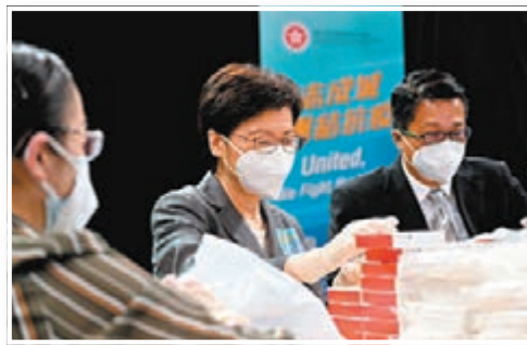
特首與公務員同事一起參與包裝工作。

在保安局統籌下，各紀律部隊同心協力派員參與製作「防疫服務包」，香港海關昨日分別從海關部隊職系、貿易管制主任職系及文書職系調配人員進行包裝工作。香港海關表示，會繼續全力支持和參與特區政府各項防疫工作，與市民一同戰勝這場疫戰。