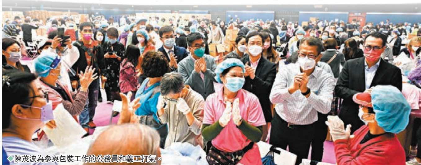
陳茂波為參與包裝工作的公務員和義工打氣。