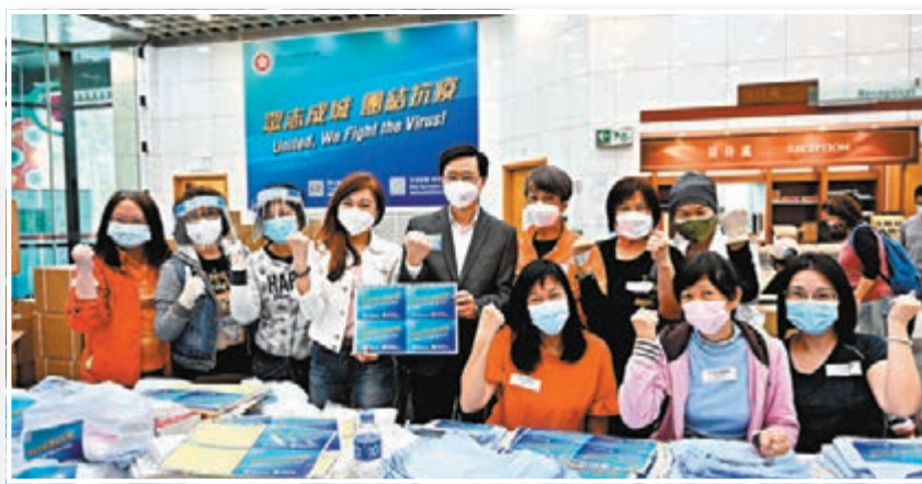
李家超(後排左五)在香港文化博物館的包裝中心與社會各界一眾義工合照。