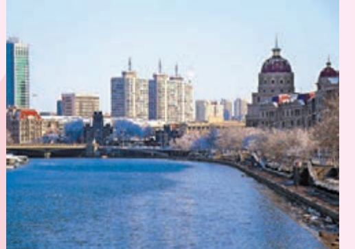
◆春雪後的天津海河景色