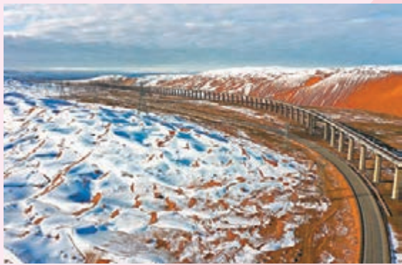
◆庫姆塔格沙漠雪景