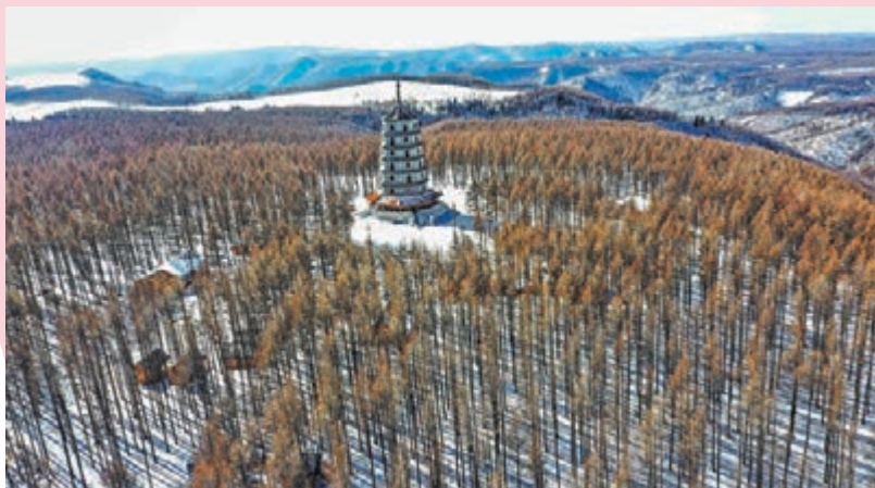
◆塞罕壩國家森林公園雪景

河北省及湖北省，在月初已下了一場春雪，位於河北省的塞罕壩國家森林公園雪後初霽，美景如畫。另外，在湖北省保康縣馬橋鎮堯治河村梨花山上，雪松景觀極為壯麗。