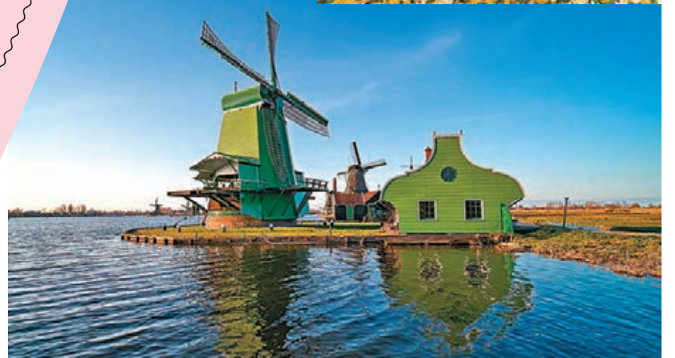
◆桑斯安斯「風車村」景色