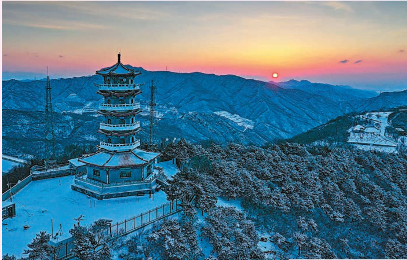
◆北京十三陵林場內的蟒山瞭望塔迎來日出