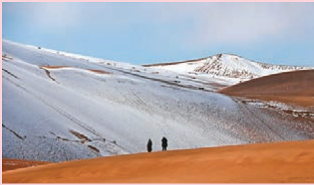
◆遊客在雪後的鳴沙山月牙泉景區遊覽。