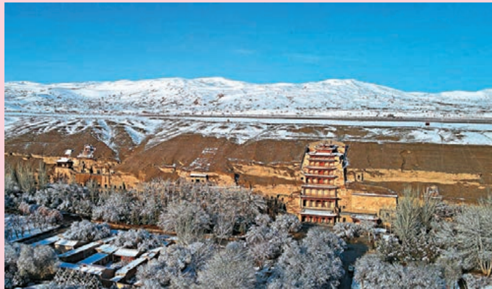
◆敦煌莫高窟景區雪景

一場春雪後，甘肅省多個地方的風光美麗，尤其是在敦煌市，雪後的世界文化遺產敦煌莫高窟銀裝素裹，當中莫高窟景區九層樓景色如畫，也有遊客在雪後的鳴沙山月牙泉景區遊覽。另外，在河西走廊的酒泉市，沙漠亦被白雪覆蓋，位於阿克塞哈薩克族自治縣的庫姆塔格沙漠雪景美麗如畫。而在南市宕昌縣官鵝溝景區，遊客在景區中欣賞雪後冰瀑景觀。而張掖市肅南裕固族自治縣大河鄉境內的祁連山，披上了一層薄紗，雲霧繚繞宛若仙境，祁連山被譽為「冰源水庫」，是中國西部重要生態安全屏障。