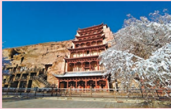
◆雪後的敦煌莫高窟景區九層樓