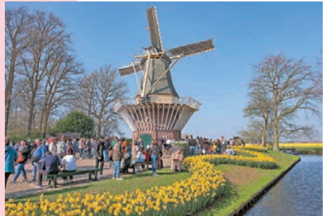
◆遊客在荷蘭利瑟的庫肯霍夫公園遊覽。