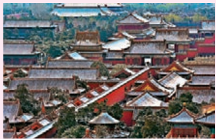
◆春雪後的北京故宮