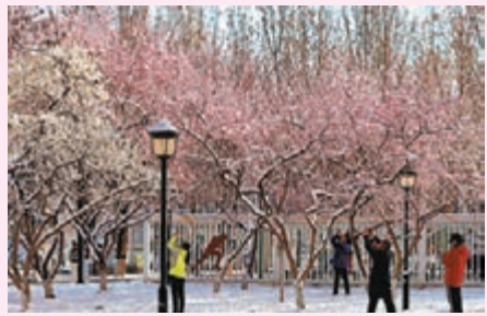
◆在大興區濱河公園，人們欣賞雪景。