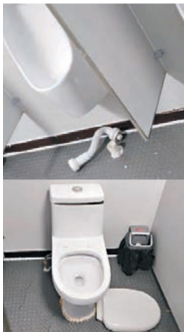
◆男廁所廁板和尿兜被破壞。