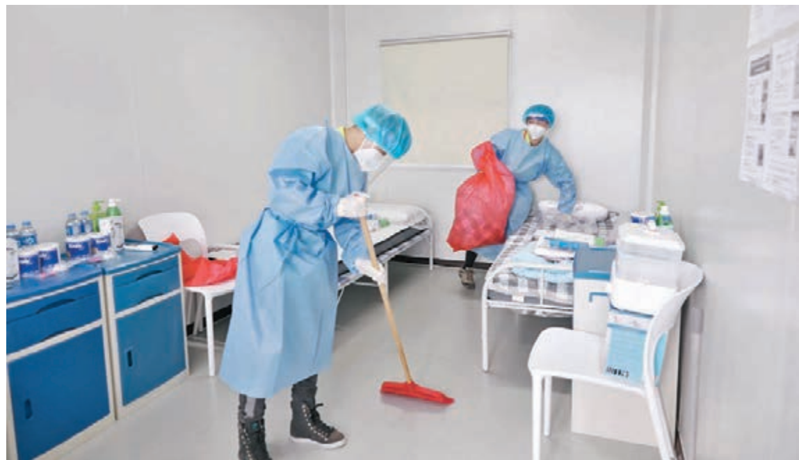
◆有清潔工表示，大部分入住者離開時房間都很整潔。