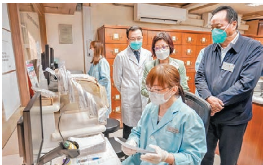
◆內地中醫專家組到訪中醫診所暨教研中心，了解診所處方中藥的工作。

香港文匯報訊（記者 文森）由中央政府援港防疫中醫專家組組長小林院士率領的內地中醫專家組昨日繼續訪港考察行程，於早上到訪醫管局，與醫管局主席范鴻齡、行政總裁高拔陸醫生和相關醫管局人員會面及交流，了解香港公立醫療機構抗擊新冠病毒