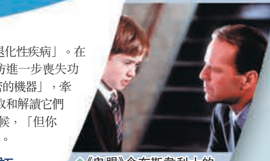
◆《鬼眼》令布斯韋利士的演技備受肯定。