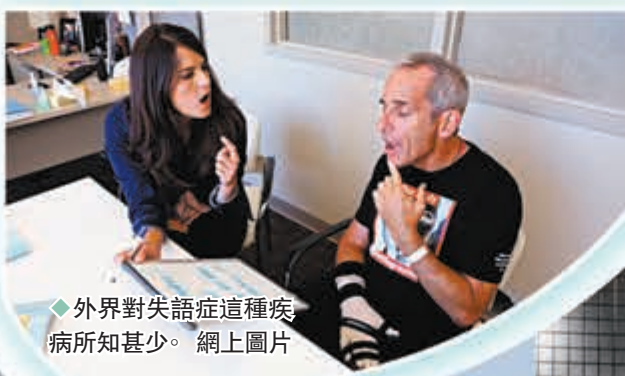
◆外界對失語症這種疾病所知甚少。網上圖片