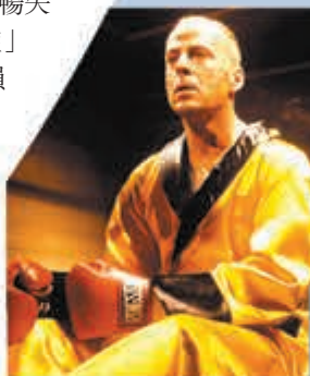
◆布斯韋利士在《危險人物》中飾演拳手。