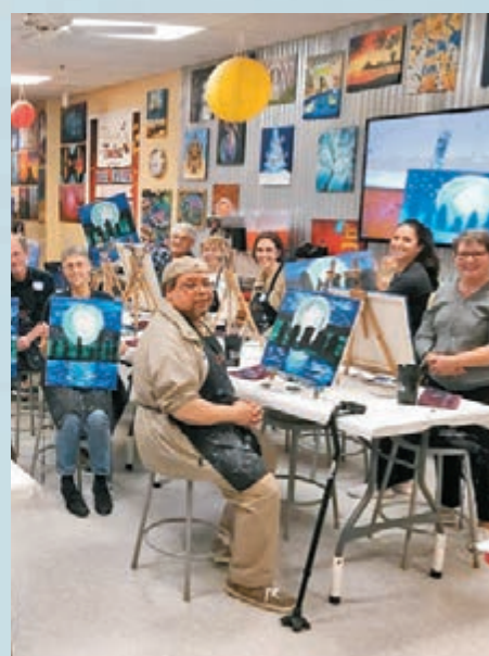
◆美國的失語症互助小組舉行畫班。網上圖片