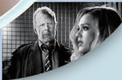
▶布斯韋利士曾主演《罪惡城》等知名電影。