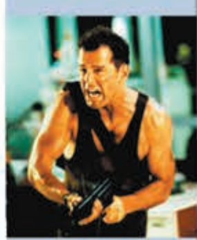
◆《虎膽龍威》是布斯韋利士的代表作。