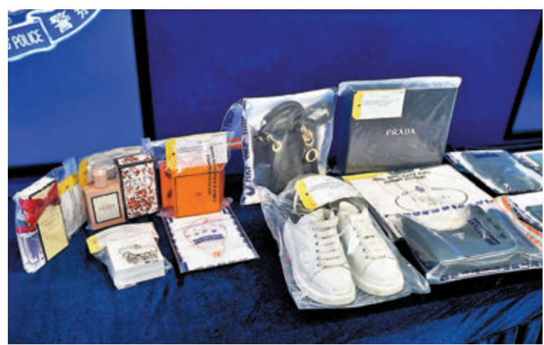
◀賣淫集團女主腦在社交平台招徠嫖客。