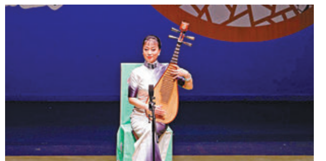
◆評彈藝術家盛小雲在表演中。 資料圖片