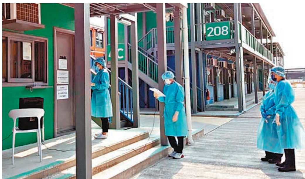
◆去年文憑試在竹篙灣檢疫中心設立試場，但不容許陽性考生應試，試場主任在試室外以擴音器向考生宣讀相關考試指示。

教育局呼籲企業在文憑試考試首兩星期盡可能採用彈性時間上班，避開早上6時半至8時半的繁忙時間，讓考生前往考場時交通更為順暢。局方亦會聯絡港鐵及巴士公司，希望在考試期間的早上加密班次，便利考生赴考。