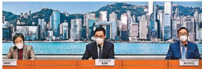
◆教育局局長楊潤雄（中）昨日在記者會上公布中學文憑試考試安排。左為教育局副秘書長康陳翠華，右為考評局秘書長魏向東。

抗擊 新冠肺炎 隨着香港第五波疫情逐步緩和，特區政府教育局及考評局昨日宣布，香港中學文憑試（DSE）會如期於本月22日開考，並於7月20日放榜。今年文憑試會首次在竹篙灣隔離設施為陽性考生設立特別試考場，並首次容許健康狀況許可的確診考生，或成為密切接觸者的考生在當中應考；有關考生需於考試當天早上6時半前向考評局申請並致電考生抗疫的士熱線安排點對點送到竹篙灣應考。竹篙灣考場最多可應付約1,000名考生。若身體狀況不適宜應考者，可在開考前申請成績評估，最高可獲5級成績。 ◆香港文匯報記者 盧博