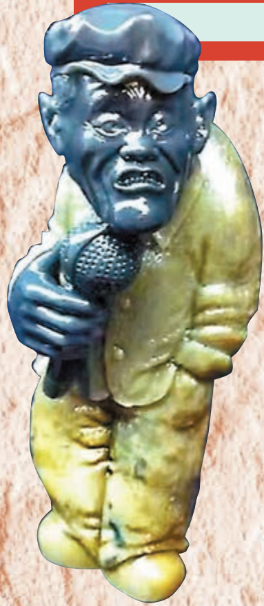
◆程鐵峰漫雕作品《趙本山》