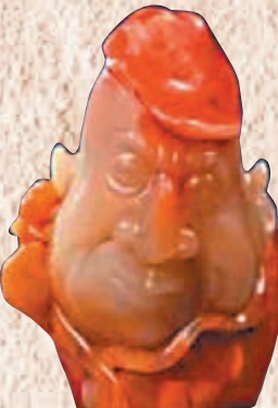
◆程鐵峰的漫雕作品