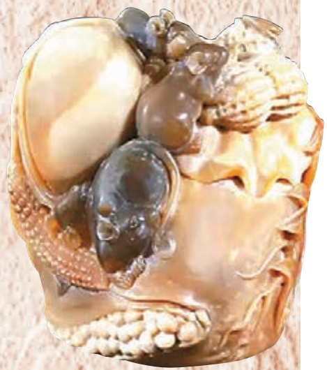
◆程鐵峰金獎作品《五子登科》