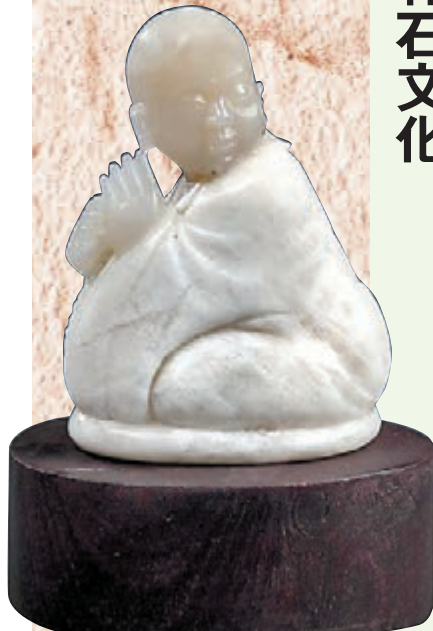
◆巴林石白玉凍巧雕一休