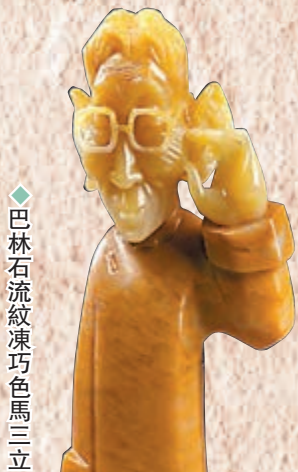
◆巴林石流紋綠巧色馬三立