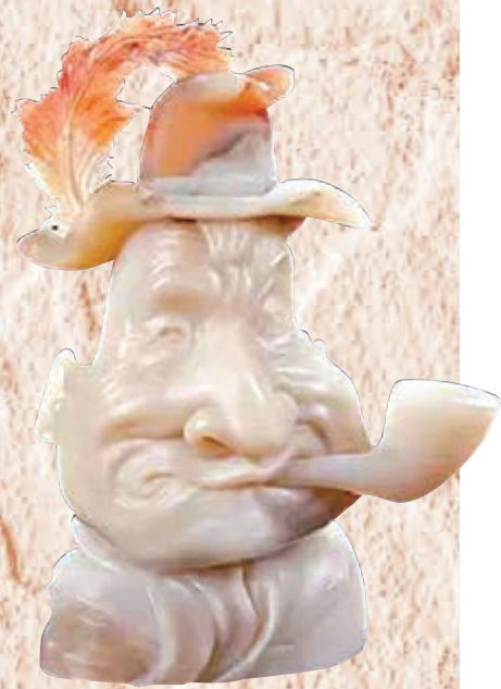
◆程鐵峰作品《老酋長》