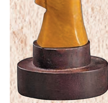
◆程鐵峰金獎作品《布袋佛》