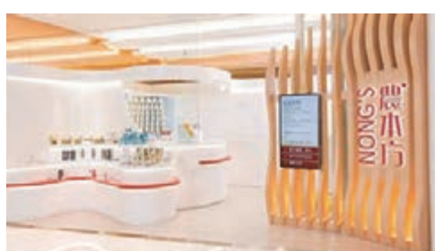
◆培力農本方參與防疫抗疫工作，以現代化中藥貢獻社會。

繼日前宣布推出中醫視像應診及支援多個社區防疫計劃後，培力農本方積極響應由香港中醫中藥界聯合總會統籌、食物及衛生局全力支持、中醫藥發展基金資助的「齊心抗疫—中醫藥遙距診療計劃」，成為計劃下的中央藥房，與參與計劃的200名中醫師合作，在診症後直接由農本方診所藥房進行配藥，按藥方即日配發四劑量的濃縮中藥配製方劑，並由培力農本方自組車隊運送，讓患者安坐家中接受一站式及專業的中醫藥服務，盡快休養痊癒。