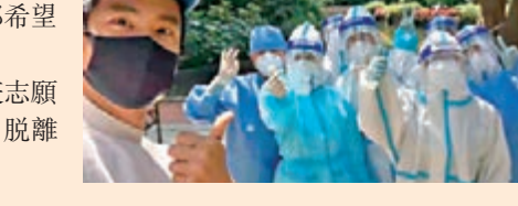
◆彭于晏（左）友善地與醫護人員合照。