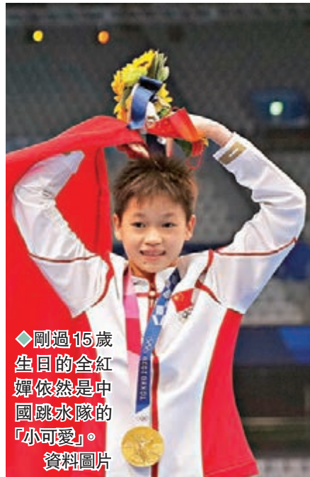
◆剛過15歲生日的全紅嬋依然是中國跳水隊的「小可愛」。 資料圖片