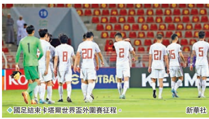
◆國足結束卡塔爾世界盃外圍賽征程。

另外，據「北青網」報道，按照「輪辦原則」，今年的東亞盃原定於7月19日至27日在中國內地舉行。但受疫情影響，中國足協已明確向東亞足協提出無法承辦本屆賽事。在這種情況下，比賽極可能易地舉辦。至於賽事最終由日本還是韓國承辦，目前各方仍在溝通之中。