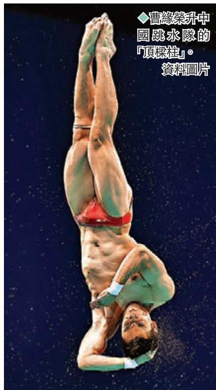
◆曹緣榮升中國跳水隊的「頂樑柱」。 資料圖片

在為期兩天的隊內測驗後，在巴黎奧運周期重新啟航的中國跳水「夢之隊」首次亮相的最大特色就是「新」：18名隊員中僅有三位是「90後」，其餘運動員全部於2000年後出生；年齡最大的選手是27歲的奧運三金得主曹緣，剛過15歲生日的全紅嬋依然是隊中的「小可愛」。