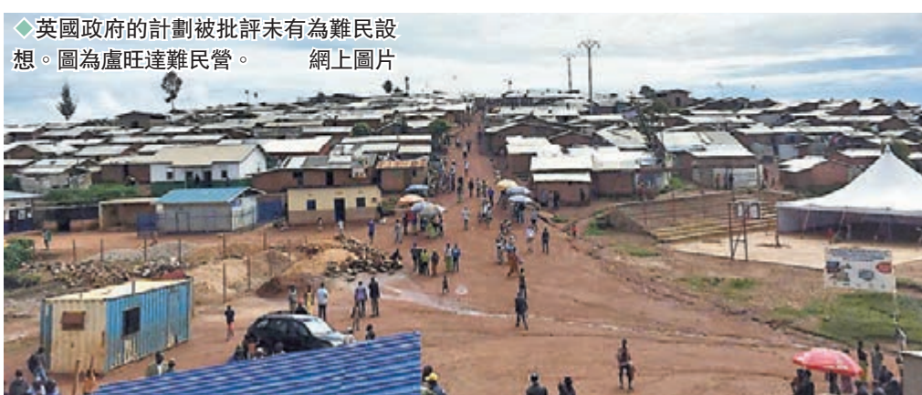
◆英國政府的計劃被批評未有為難民設想。圖為盧旺達難民營。

英國等西方國家近年不斷挑起地緣衝突，卻用嚴苛移民政策將大批尋求庇護的難民拒之門外，更試圖利用「銀彈」，將難民轉送到其他國家。英國多個媒體昨日揭露，首相約翰遜正考慮利誘非洲國家盧旺達，要求其協助安置英國轉送的難民。這項所謂「保護英國和國民」的計劃引來齊聲譴責，有上議院議員直斥計劃如同建立「英版關塔那摩監獄」，最終只會演變為人道主義危機。