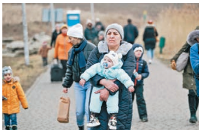
◆英國並不心甘情願接收烏克蘭難民。資料圖片