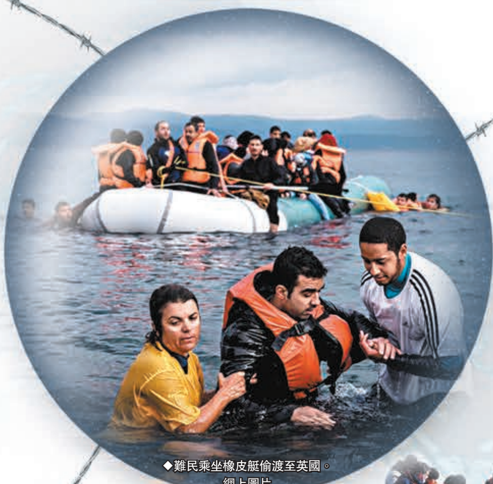
◆難民乘坐橡皮艇偷渡至英國。網上圖片