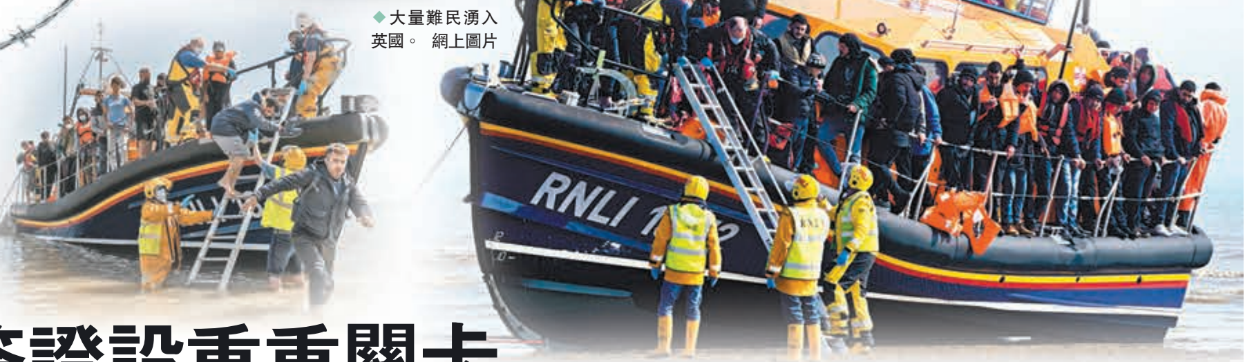
◆大量難民湧入英國。網上圖片