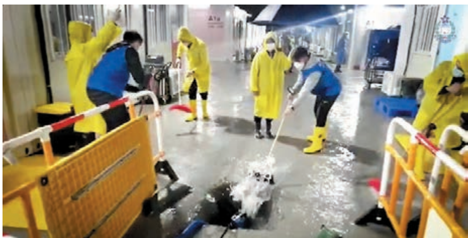
▲入境處人員上下一心，奮力清理於方艙醫院內，因滂沱大雨下形成的積水。視頻截圖

香港文匯報訊（記者 文森）踏入風季雨季，天氣變幻無常，入境處人員無懼風雨，緊守崗位，為入住方艙醫院的患者提供24小時全天候的貼身服務。即使在風雨交加情況下，入境處人員上下一心，奮力清理滂沱大雨下形成的積水，並於早前寒冷天氣下，送上一份份溫暖的飯菜到正在隔離的市民手中，在惡劣天氣下送上點點溫暖。 入境處指縱使天有不測之風雲，入境處人員依然無懼風雨，緊守崗位，為市民提供24小時全天候的貼身服務，同時亦積極與中建配合及商討對策，因時制宜，於惡劣天氣下作出迅速的應變，例如加設行人過路板、利用大型抽水器及沙包，即時迅速疏導雨水。 社區隔離設施由中央援建，保安局統籌運作，入境處負責管理其中3個社區隔離設施的日常運作，分別為新田、洪水橋及青衣社區隔離設施，合共有超過2,300間房間供隔離人士使用，可容納約8,000人。入境處有超過900名人員在隔離設施輪班工作，24小時為入住的市民服務。