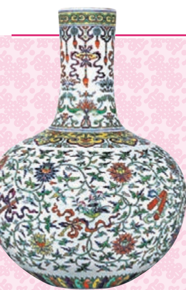
◆ 清乾隆鬥彩加粉彩暗八仙纏枝蓮紋天球瓶六字篆書款。