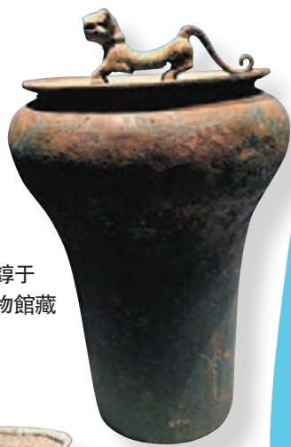
◆ 漢代鐙子 國家博物館藏