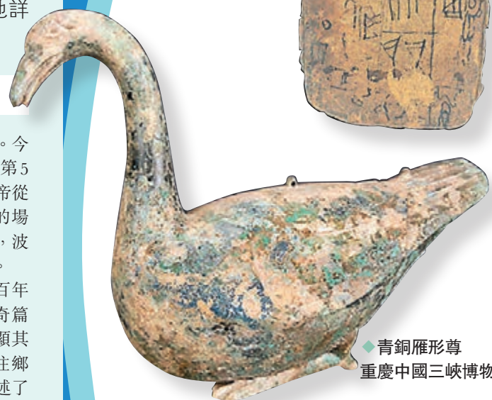
◆ 青銅雁形尊 重慶中國三峽博物館藏

趙永表示，今次展覽是繼「甲骨文」、「紅樓夢」、「孔子」等大型文化展之後，國博提煉和展示中華優秀傳統文化精神標識的又一重要嘗試。希望通過長江文化展，廣續中華民族歷史文脈，堅定全民族文化自信。