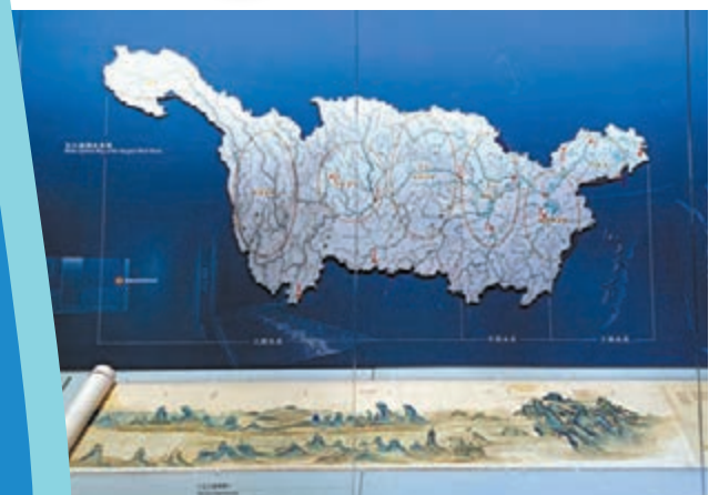
◆ 長江流域水系圖(上)和清代《長江流域圖》。 國家博物館藏