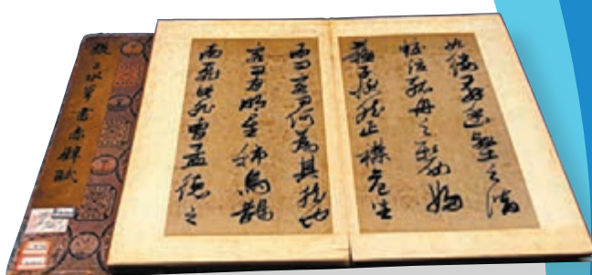
◆ 明代張璠圖畫《前赤壁賦冊》。 國家博物館藏