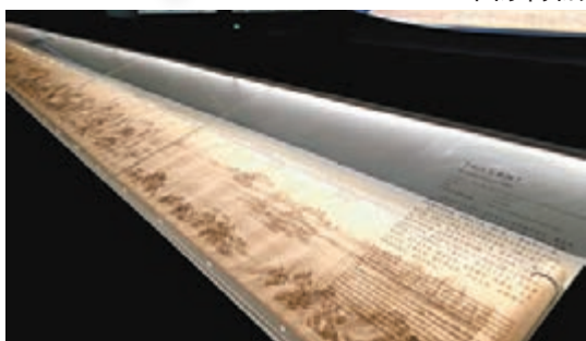
◆ 清代《長江萬里圖》 國家博物館藏