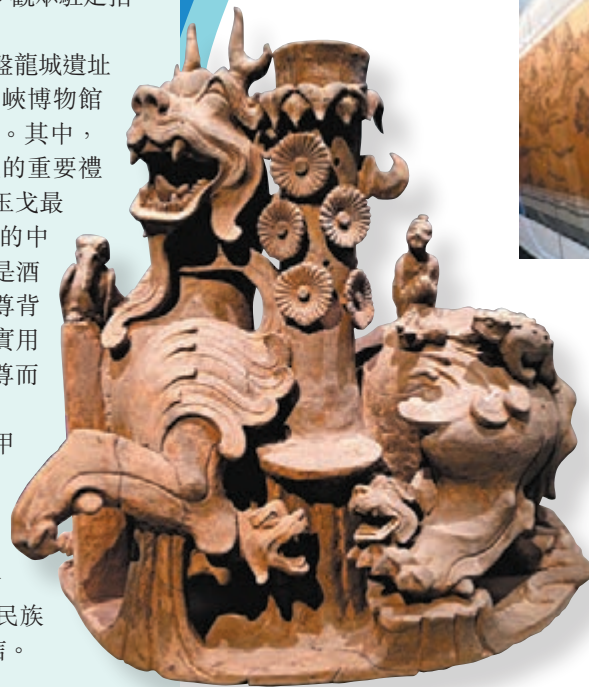
◆ 東漢晚期至蜀漢 陶搖錢樹座。 重慶市文物考古研究院藏