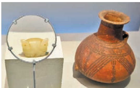
◆ 新石器時代石家河文化玉虎首(左)和新石器時代馬家窯文化單耳彩陶罐。 國家博物館藏