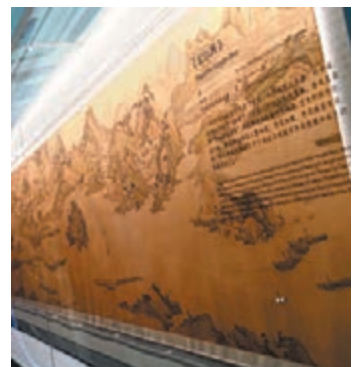
◆ 清代《長江圖》局部 國家博物館藏