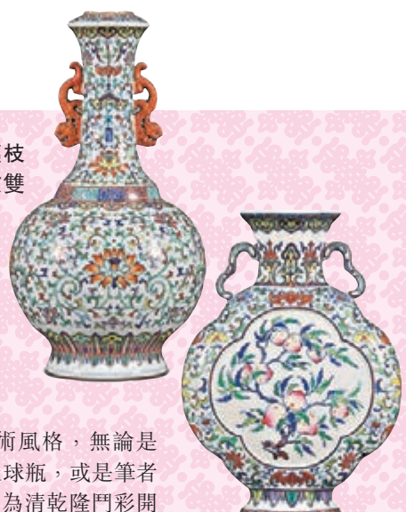
◆ 清乾隆鬥彩開光靈芝壽桃紋海棠式扁瓶。