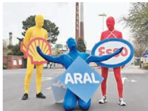
德國示威者抗議油企繼續從俄國輸入汽油。路透社