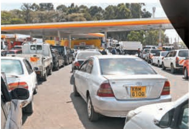
俄烏衝突刺激全球油價上升。圖為4月4日肯尼亞油站。法新社