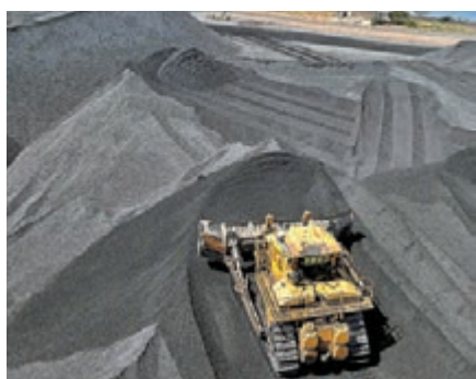
澳洲煤炭預料成為當地第二大出口商品。