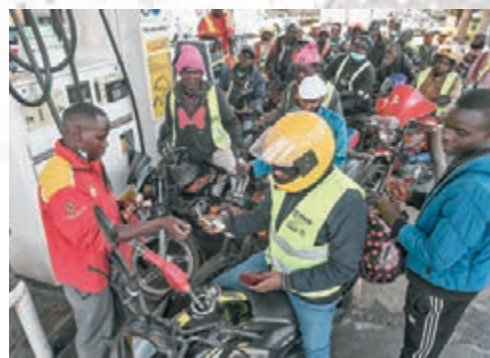
油價上升加劇多地通脹。