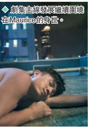
◆劇集主線發展繼續圍繞在Maurice的身世。