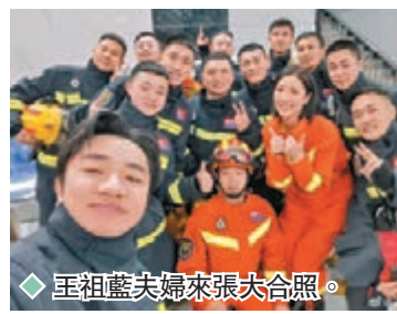
◆王祖藍夫婦來張夫合照。

香港文匯報訊(記者 阿祖)王祖藍與太太李亞男日前參與內地節目《勇往直前的我們》,兩夫婦齊穿上消防員制服及裝備,一同體驗消防員一天的工作。王祖藍表示有幸體驗了消防員的一天:「和消防員一起,給大家科普消防知識,玩遊戲、唱歌...短暫接觸也深深感受到消防員的付出與堅持,整個過程真的是收穫滿滿!」祖藍又提到,學好消防知識,保護自己又保護他人,也能減少他們的出動概率。