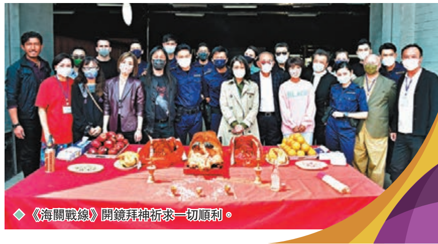
◆《海關戰線》開鏡拜神祈求一切順利。