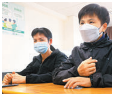
◆港鐵承辦商高鐵站保安陳小姐（左）和楊小姐。

日曬雨淋，拿着12,000元的最低月薪，楊小姐和陳小姐對工作本身沒有半點怨言，「辛苦是肯定的，只希望政府能夠一視同仁對待我們保安，為什麼政府承辦商的就有資格，港鐵承辦商就不行？」