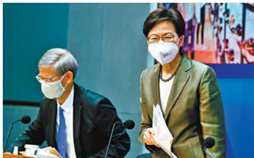
◆特首林鄭月娥昨日公布「2022保就業」計劃優化方案，取消了員工3萬元或以上月薪不資助的規限。左為勞工及福利局長羅致光。