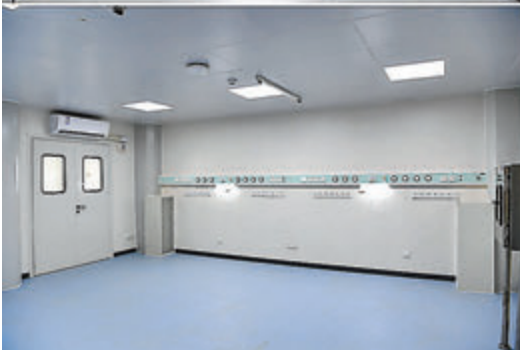
◆應急醫院一期內部環境。 新華社