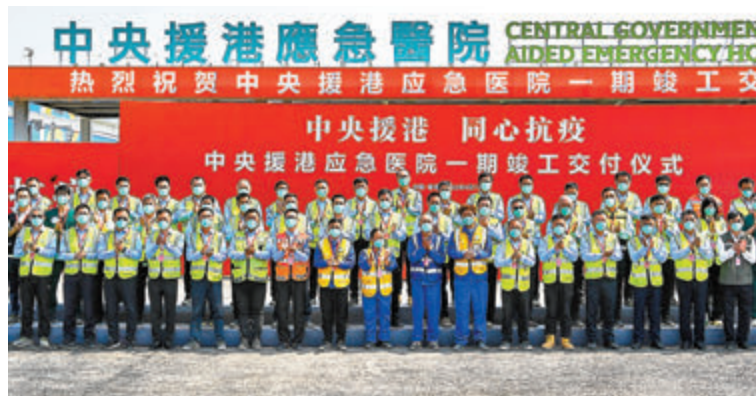
◆中央援港應急醫院項目，昨日舉行一期工程竣工交付儀式。

香港文匯報訊 位於香港落馬洲河套地區的中央援港應急醫院項目，昨日舉行一期工程竣工交付儀式。項目包括中央援港應急醫院、中央援港落馬洲方艙設施、生活配套設施三個部分，總用地面積約50萬平方米，總建築面積約28.31萬平方米。未來將提供500張床位的負壓病房，有效提升香港收治新冠肺炎確診患者的能力。