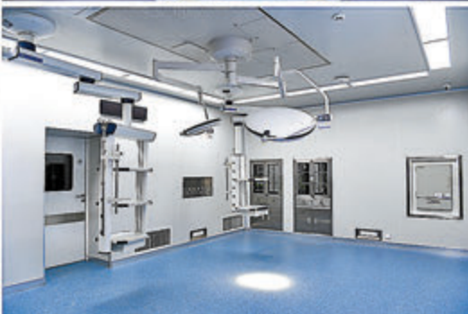
◆應急醫院一期內部環境。

中央援港應急醫院是一所呼吸科傳染病專科醫院，全部建設完成後將擁有1,000張床位的負壓病房，包含3間手術室和100張ICU病床，以及放射科、檢驗科、中心供應、輸血科等醫技設施，以及藥房、污水處理站、氧氣站、負壓牽引站等醫療配套設施。該項目預計將於本月底全部完工交付。