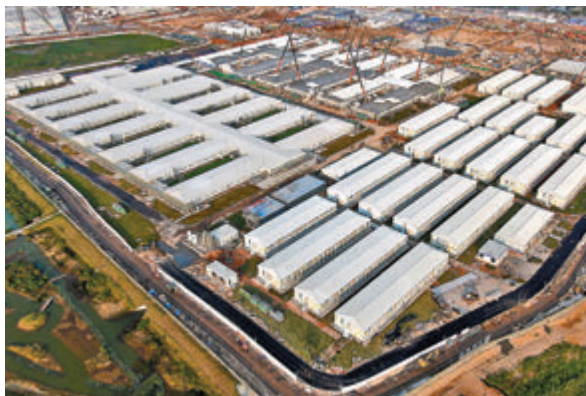
◆無人機航拍應急醫院一期。