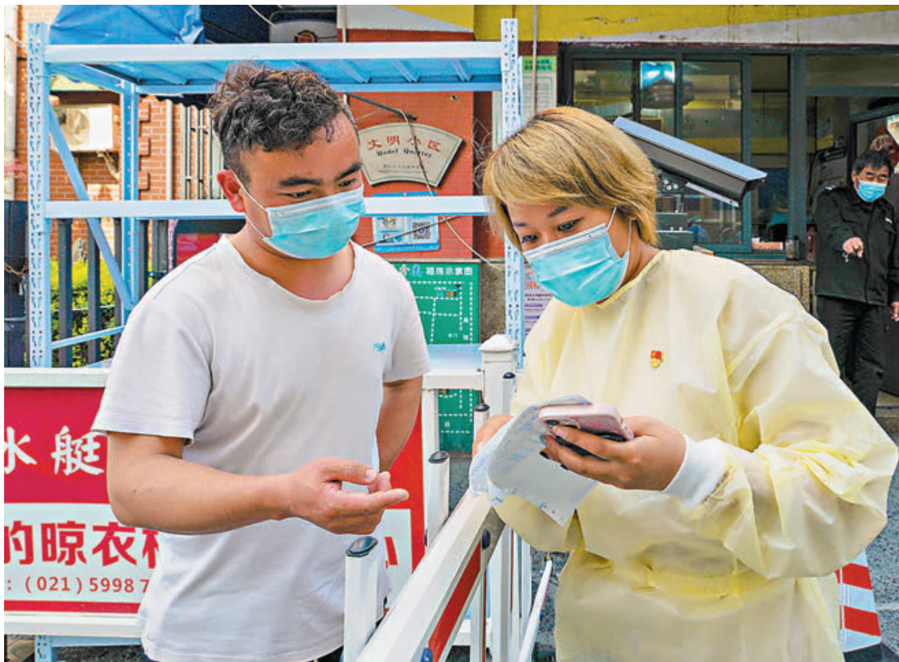
◆上海明確調整了物資供應保障人員的返崗政策，來自全國四面八方超過千名騎手、快遞員、分揀員正投入到上海保供崗位中。圖為電商平台對騎手實行嚴格的防疫政策：閉環住宿、定時核檢、戴口罩開工等。