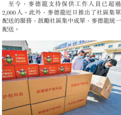
◆4月7日，新疆首批援滬防疫物資，1.6萬份新疆特色乾果盒裝車出發。據悉，新疆援滬所有防疫物資共計10萬份，貨值800萬元人民幣。中新社

4月7日，新疆首批援滬防疫物資，1.6萬份新疆特色乾果盒裝車出發。據悉，新疆援滬所有防疫物資共計10萬份，貨值800萬元人民幣。