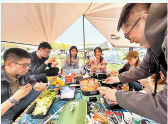
◆筆者與同事好友到京郊露營聚餐。

四季分明的北京，春天來得格外的快。彷彿一夜的工夫，北京的花就都開了，中午的氣溫也高得嚇人，大家也紛紛從羽絨服換成了衛衣甚至T恤，隨着玉淵潭的人潮一起看花去，在弱柳扶風處野餐、春遊，其樂融融。這種勃勃生機、萬物競發的場面，適合獨自憑欄，更適合三五成群地探討理想。畢竟，一切都是剛起頭，孕育着春色，也孕育着希望。