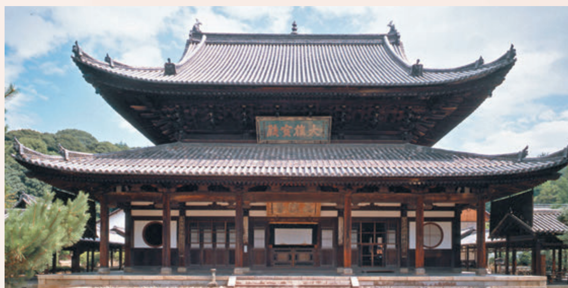
◆日本京都黃檗山萬福寺 網上圖片