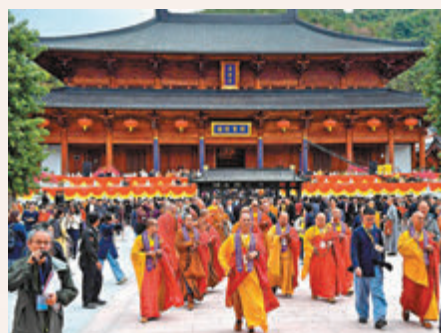
◆福建福清黃檗山萬福寺 資料圖片