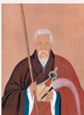
◆隱元禪師的紙本畫像

2022年是中日邦交正常化50周年，也是中國一代高僧、日本黃檗宗宗祖隱元禪師圓寂350年。2月25日，日本宮內廳向日本黃檗宗頒授冊書，日本天皇向隱元加謚「嚴統大師」。據悉，這是隱元禪師第七次受到日本皇室加封。日本黃檗宗很早就成立了「紀念隱元宗祖遠諱350年委員會」；日本駐華大使垂秀夫去年11月初到福建訪問，也特別造訪了與日本淵源深厚的福清黃檗山萬福寺、福州開元寺、福州琉球墓園等地。中日兩國相關機構將攜手舉辦紀念隱元禪師等活動，續寫兩國友好交流佳話。