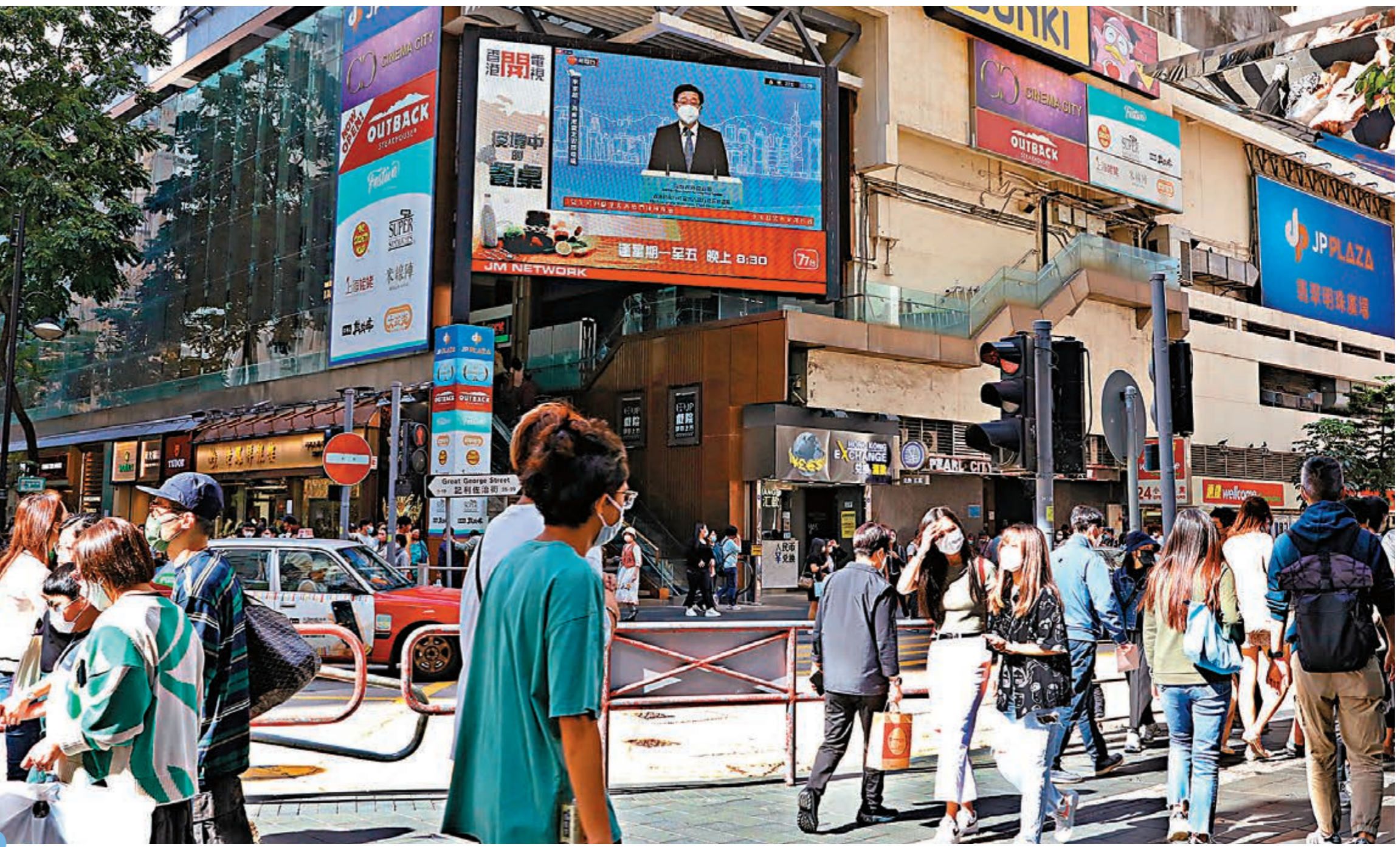
◆銅鑼灣大電視播放李家超記者會片段。