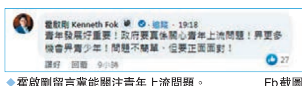
◆霍啟剛留言冀能關注青年上流問題。

團結香港基金顧問、香港再出發大聯盟共同發起人劉仲恒留言道，香港需要一個夠「硬淨」、有膽識、有領導能力，以維護港人福祉的特首，才能擔起重建香港輝煌的使命。「全力支持李家超，未來5年是由治及興關鍵時刻，