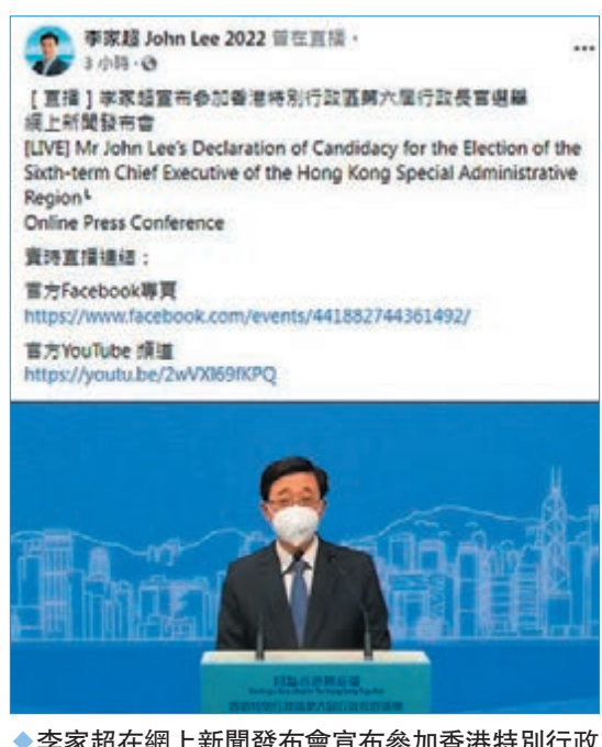
◆李家超在網上新聞發布會宣布參加香港特別行政區第六屆行政長官選舉。

為了達到更好的成果，惠及社會和市民。如果我成功當選，新一屆政府會在「愛國者治港」原則下，積極與社會各界和市民互動，制定解決各種問題的政策措施，讓市民真正得到實惠，分享發展紅利。