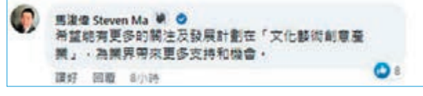
◆馬傑偉留言希望關注「文化藝術創意產業」。