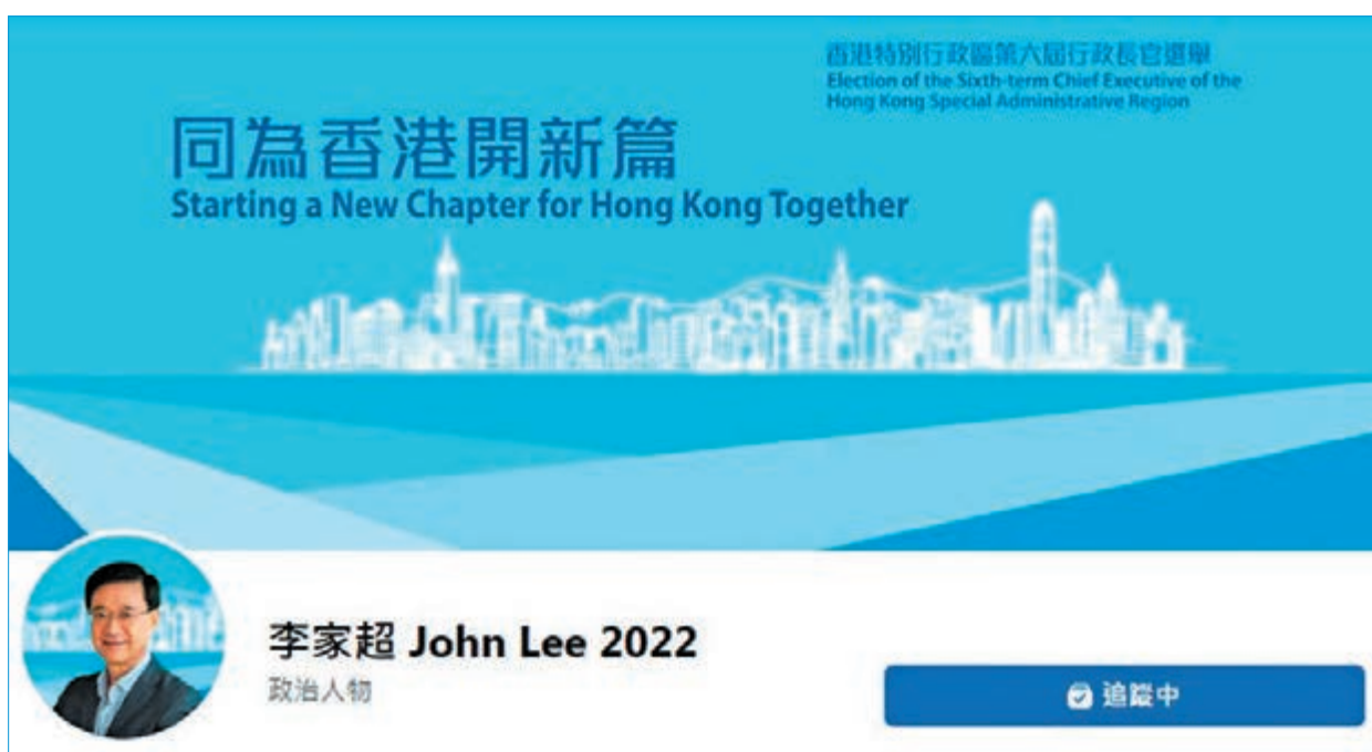
◆李家超的Facebook競選專頁。

長期以來，香港累積一些深層次的問題，包括房屋、醫療、青年發展等，未能很好地解決。變革的目的，是