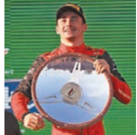
◆勒克萊奪得第二個分站冠軍。

中國車手周冠宇第14位發車，最終以第11名完賽，與上站持平。他賽後接受新華社記者專訪時表示，第一次在墨爾本比賽，要迅速適應和掌握新賽道不是容易的事，不過自己在發車、對引擎聲音更好的判斷、第一圈對防熄火系統的適應等方面都有所提升，讓他對後續比賽更有信心；整場比賽也完全執行了車隊所有要求，基本沒有失誤，有些可惜是安全車在不對的窗口被觸發，導致他與積分失之交臂。