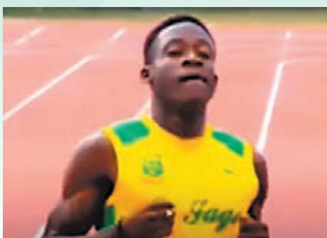
◆派斯展現驚人爆發力。

本場勝利後，皇馬在西甲積分榜上以22勝6和3負積72分繼續領跑，領先排在第2位的西維爾12分，在尚餘只有7輪比賽的情況下，皇馬繼續在冠軍爭奪戰中遙遙領先。皇馬主帥安察洛堤賽後指出，在歐聯比賽後接戰的比賽精力很容易無以為繼，幸而球員在大戰車路士過後反應得不錯。馬德里體育會在本輪比賽則作客以0:1不敵馬略卡，在第4位的優勢只有1分。