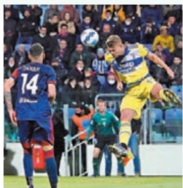
◆祖記後衛迪歷特頂入扳平。

意大利甲組聯賽當地9日的第32輪較量，賽前落後榜首AC米蘭4分的國際米蘭，憑尼高路巴列拿和迪斯高上半場的兩個入球，主場以2:0戰勝維羅納；同日全取3分的還有為保前四而努力的祖雲達斯，他們作客以2:1反勝卡利亞里。