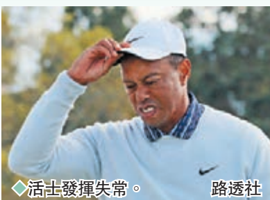
◆活士發揮失常。路透社

據新華社報道 第86屆美國高爾夫球大師賽9日在奧古斯塔國家高爾夫俱樂部結束第3輪比賽。排名世界第一的舍夫勒打出71桿，以207桿的三輪成績領先第2名的史密斯3桿。久休復出的「老虎」活士本輪發揮失常，全場吞下兩個雙「柏忌」、5個「柏忌」，抓到3個「小鳥」也於事無補，最終交出78桿，而這也是他在美國大師賽上的歷史最差單輪成績，本輪過後以223桿的總成績並列第41名。