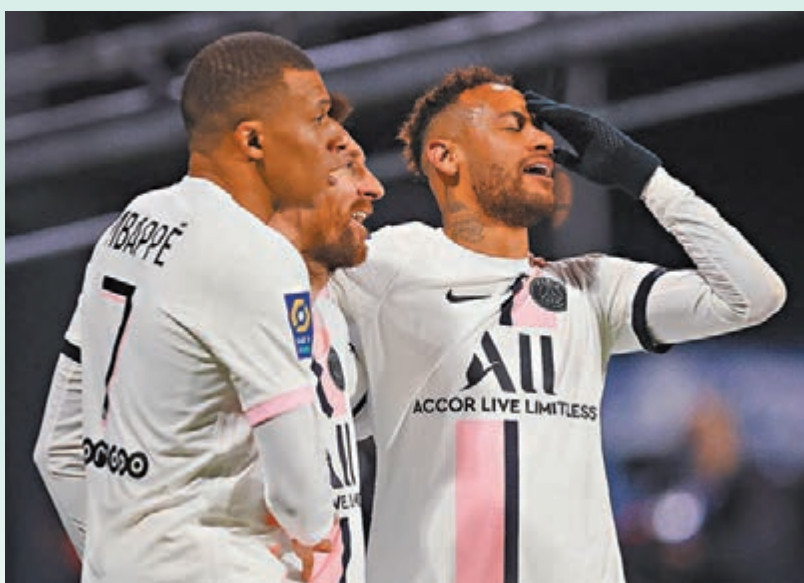
◆(左起)麥巴比、美斯與尼馬再次聯手炮製大屠殺。

憑藉本場比賽的3個入球，麥巴比以20個入球暫時登頂聯賽射手榜榜首，同時在助攻榜上以14次助攻排名第1，美斯則以13次助攻排名第2。PSG主帥普捷夫天奴賽後說：「MNM組合？問題是很多人不肯聽，打從球季開初我們就說過，他們需要時間去互相了解彼此，不僅是在球場上，還有在更衣室裏。」麥巴比在接受Canal Plus電視台訪問時亦表示：「很遺憾，它(MNM真正的火花)現在才來，有一些事耽誤了我們的時間。」