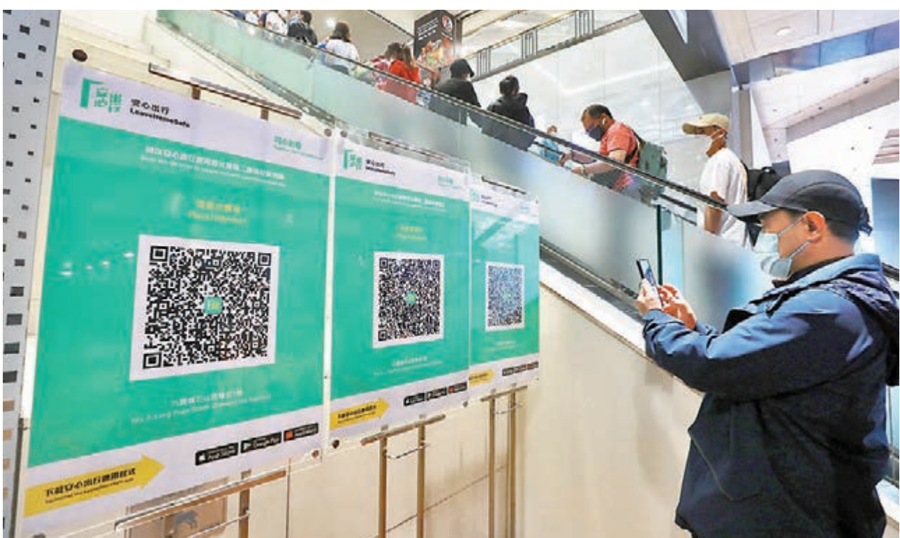
▲徐德義表示，接種數字顯示「疫苗通行證」之實施對提高接種率有明顯成效，亦達到了推行目的。圖為市民進入商場時先掃描「安心出行」。

另外，部分人獲得醫生證明書可豁免接種疫苗，亦有人因屬新冠康復者而可延期接種疫苗，但他們要在進入必須使用「疫苗通行證」的處所時提供相關證明，例如出院紀錄、康復紀錄、由政府或獲衛生署認可計劃承認的認可私營醫務化驗所發出的陽性核酸檢測短訊或紀錄、快速抗原測試陽性結果人士申報系統的成功申報短訊/電子紀錄，又或隔離令等，林林總總，文件比較零碎及不統一。特區政府正計劃透過整合一個康復平台，讓他們可將資料一次過掃描而不用將不同款式的紙本文件出示，方便處所管理人識別。有了新平台後，康復者進入處所時只需透過一個二維碼，令使用障礙得以減少，更加便利；處所掌管人也可透過科技更易識別。籌備工作正在進行中，估計4月或5月可以出台。我認為，從疫苗接種情況足以反映，自我們宣布推出「疫苗通行證」後，已有很大誘因令接種率迅速提高，已達到政策原意。雖然接種速度近來又慢下來，但「疫苗通行證」並非唯一一種方法提高接種率，而是要透過多種途徑，例如教育及由醫生向病人及其家人解釋接種疫苗的好處，希望他們願意接受。