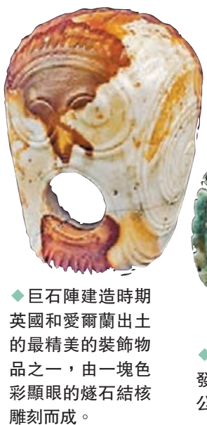
◆巨石陣建造時期英國和愛爾蘭出土的最精美的裝飾物品之一，由一塊色彩顯眼的燧石結核雕刻而成。