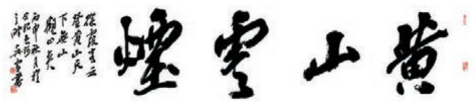
◆吳雪作品《黃山雲煙》，232cm x 52cm。