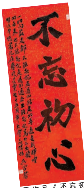
吳雪作品《不忘初心》，138cm x 51cm。