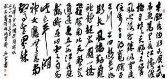
◆吳雪作品《毛澤東·水調歌頭·游泳》，240cm x 120cm。

基於這種理念，吳雪在書法創作上進行了諸多嘗試。舉辦以創新發展為主題的《春天的故事》個人展覽，用書法作品演繹一曲春天的樂章，講述從風陽小崗村到深圳鵬城的改革、創新故事。以民族復興為主題創作《中國夢》書法長卷，將書法的書寫形式與內容深入融合，用書法的韻律展現中國未來發展的氣勢恢宏。吳雪說，作為一名書寫者，唯有緊跟時代步伐，與時代同行，才能使書法藝術在當代煥發出歷史的光彩和無窮的魅力，他亦將繼續放歌熱土，書寫時代。