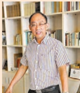
◆吳雪談書法，需技藝雙修，更要藝道互進。

文以載道，以藝弘道。吳雪認為，弘揚書法文化是一項當代書寫者的重要責任。早在擔任安徽省文聯主席期間，吳雪就通過舉辦各種書法大展、書法交流活動等，推動安徽省書法進一步發展。彼時，他多次組織書法名家走進安徽各大校園，傳播書法文化，以期讓更多學生感受書法魅力。二〇二一年，他牽頭推動安徽省書法教育「雙千」工程，即促成安徽省教育廳與安徽省文聯合作，雙方共同培養一千名書法教師，並組織書法名家走進一千所中小學課堂，從小培養學生的書法興趣，助力我國書法藝術發揚光大。 工作期間，吳雪通過調研了解到，國內學校普遍存在缺少專業書法教師的情況，而這情況短期內亦較難解決，因此給書法進校園的推進帶來障礙。「借助安徽省文聯擁有的眾多書法家資源，可以幫助教育廳在現有教師資源的基礎上培養優秀的書法教師，進而解決各學校書法教師短缺的難題。」吳雪介紹，在此基礎上，通過對書法家進行標準化教育培訓，組織書法家走進千所校園，亦可更好幫助學校師生在書法方面得到提升。 一字一世界，一筆一精神，傳承承載着中華文化的書法藝術，是教化育人、塑造文化自信、提升民族凝聚力、弘揚中國精神的重要舉措。吳雪表示，這一模式後續還可為戲劇、民樂等傳統藝術進校園提供參考，助力更多優秀傳統藝術傳承發展。