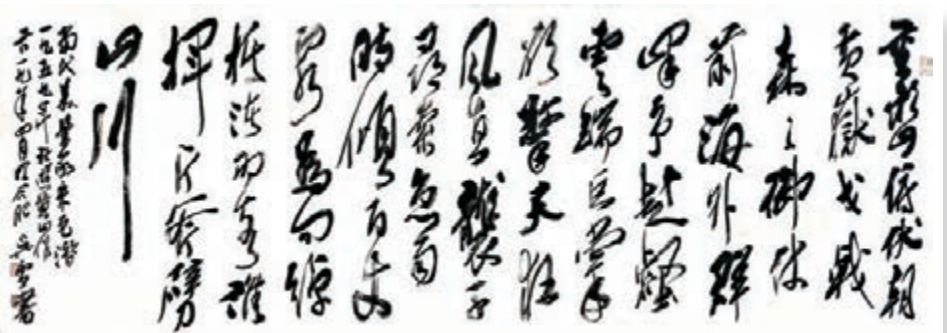
◆吳雪作品《當代美學家朱光潛遊黃山作》，248cm x 88cm。