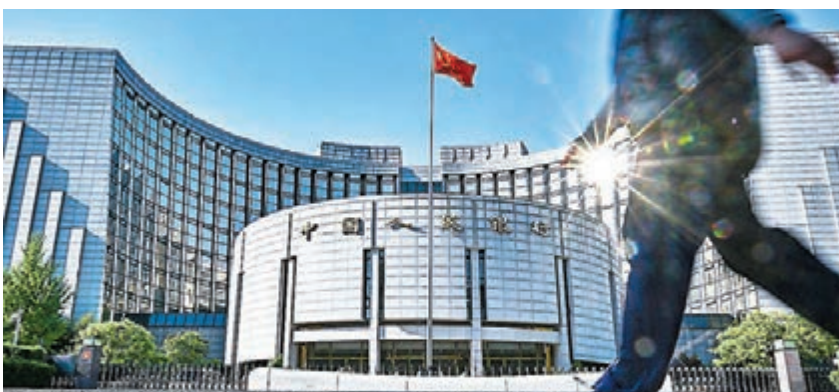
◆中國人民銀行公布，3月社會融資規模增量4.65萬億元人民幣。 資料圖片

香港文匯報訊（記者 海巖 北京報導）3月內地新增信貸和社融明顯反彈，超出市場預期。中國人民銀行昨日公布，3月人民幣貸款增加3.13萬億元（人民幣，下同），同比多增3,951億元，比2月多增1.9萬億元；社會融資規模增量4.65萬億元，同比少增1.77億元，環比多增3.46萬億元。專家指出，3月信貸、社融和貨幣增速均超預期，作為領先指標顯示穩增長政策發力下經濟呈現暖意，但近期內地