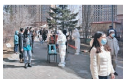
◆內地部分城市因應疫情按下暫停鍵，影響內地今年經濟增長。

元指數上升6.4%，同期人民幣兌美元升2.6%，認為與內地經濟，特別是對外貿易表現向好、疫苗接種率提高和避險情緒降溫等有關。展望今年，她料多項因素繼續支持人民幣匯率表現，如內地經濟實力進一步增強、經常賬盈餘較高、內地金融市場對外開放進程穩步推進，以及人民幣金融資產對國際投資者具有一定吸引力等。