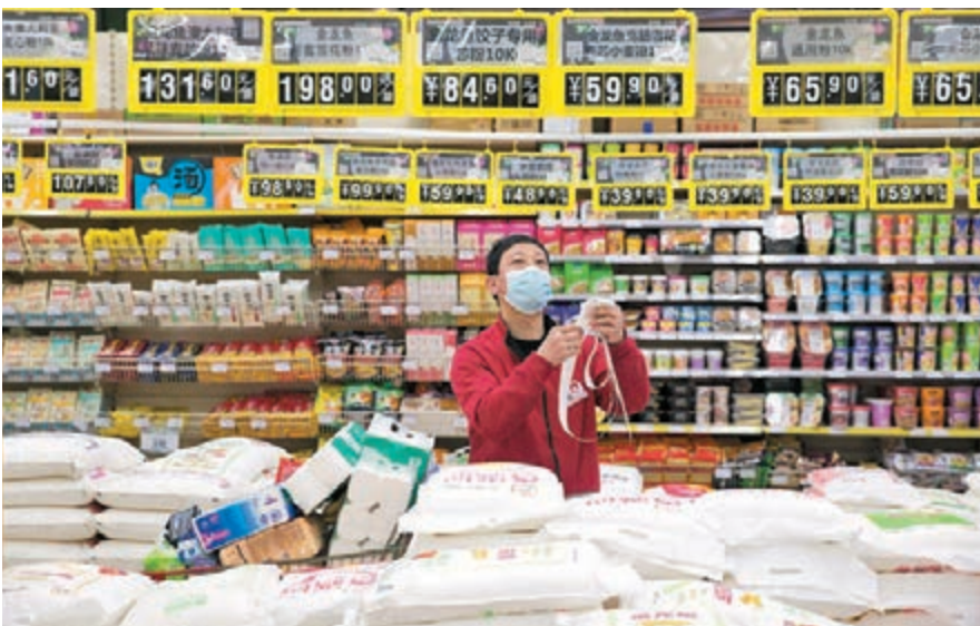
◆內地麵粉、食用植物油、鮮菜和雞蛋價格環比上漲1.7%、0.6%、0.4%和0.3%。 中新社

工業品方面，受2021年同期數明顯抬升的影響，3月PPI同比漲8.3%，較2月回落0.5個百分點，連續五個月漲幅回落，但環比上漲1.1%，漲幅擴大0.6個百分點，為2021年11月以來最高。地緣政治等因素推動國際大宗商品價格持續上行，帶動國內石油、有色金屬等