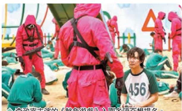
李政宰主演的《魷魚遊戲》入圍多項百想提名。

香港文匯報訊（記者文芬）韓國《第 58 屆百想藝術大獎》將於下月 6 日舉行，大會昨日公布了今年電視劇、電影及綜藝部門的入圍名單。其中李政宰早前憑《魷魚遊戲》在美國拿下多個獎項，今次以大熱姿態入圍角逐百想視帝，自然成為焦點。