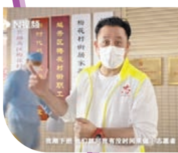
麥長青收工後仍不辭勞苦當義工。

另外，藝人黃一山（細龜）多年來在內地有不俗的發展，現時他在廣州，當地開始有疫情爆發，他也一盡市民責任去做核酸測試。細龜於前晚到檢測採樣站時，依然大排長龍，醫護人員忙個不停，細龜拍下打氣視頻表示：「現在已經是晚上 10 點，我在樓下的小區排隊做核酸（檢測），你看現在排隊的人還是蠻多的，其實我們不算辛苦，最辛苦還是那些工作人員，他們穿着厚厚的防疫衣服不透風，從早上開始工作到現在，廣州白天的溫度是 30 多度，他們頂着那種很辛苦的環境工作，所以我們都要配合他們，我相信疫情終會過去，廣州加油！中國必勝！」細龜亦表示，這半個月已拒絕一切應酬及工作，乖乖留在廣州。