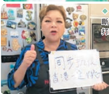
肥媽不斷為港人打氣。