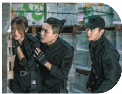
黃宗澤再度成功走入國際。

Bosco 入行至今超過二十年，參演過不同電影、電視劇，2013 年憑《護花危情》成為新加坡視帝，2014 年憑電影《男人唔可以窮》榮獲第 6 屆