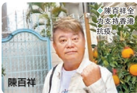
陳百祥全力支持香港抗疫。