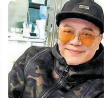
歐陽震華響應呼籲做檢測。