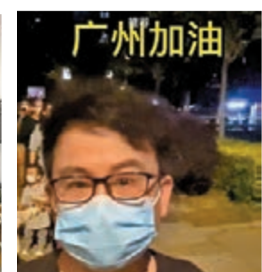
黃一山樂於配合做檢測。