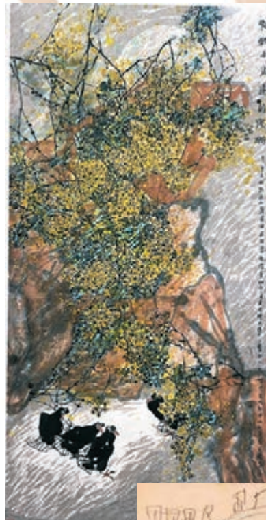
◆江文湛作品《啊，終南永遠的燦爛》。