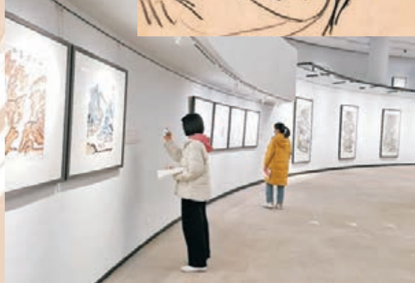
◆西安站展覽現場展出百逾幅名家作品。