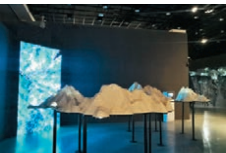
◆《夢裏尋夢》的「洞天科幻」。