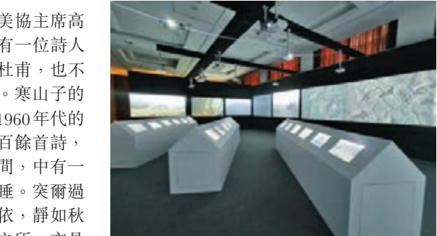
◆《山水：富春江作為方法》系列作品。

少」這樣的似問非問，這裏面的寂寥、通達的意味，直到他讀碩士時的一天，才真正意識到是什麼意思，「我們從小耳熟能詳的這些句子，在人一生的生命歷程中會不斷地浮現出來，開啟人們彼時的感官和心智，讓我們在面對世界時會有所感，有所觸。」