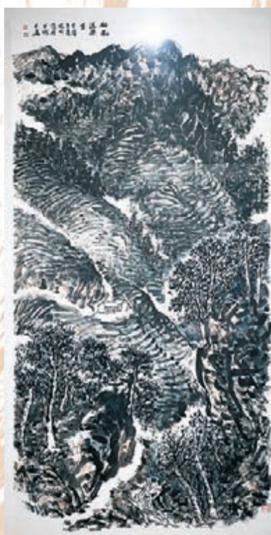
◆趙振川作品《松風送茶香》。