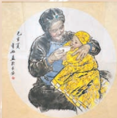
◆王有政作品《奶奶和孫孫》。