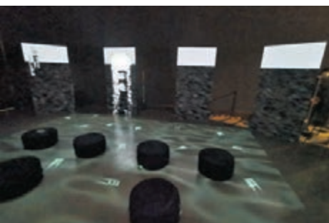
◆《詩藏萬象》多媒體展示詩句「江清月近人」。