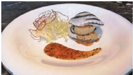
◆ 黑松露帶子貝殼包