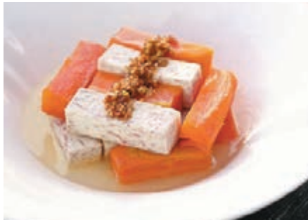
◆ 「反沙芋條」是潮州的經典甜品。