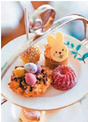
◆ 復活節兒童下午茶

◆ LINE FRIENDS 與奇華餅家攜手推出復活節期間限定「LINE FRIENDS WITH KEE WAH BAKERY 什錦曲奇禮盒」，LINE FRIENDS 的 BROWN & FRIENDS 紛紛回到兒時純真可愛的樣子，變身成 MINI BROWN & FRIENDS，並帶着三款美味的曲奇，包括鬆脆可口的腰果牛油曲奇、清新香甜的小紅莓牛油曲奇及香氣濃郁的杏仁片朱古力曲奇，均以優質牛油及麵粉製成，口感豐富，讓大家享受多重滋味，而禮盒特意