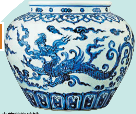
明永樂 青花夔龍紋罐 估價：45,000,000 - 65,000,000 港幣