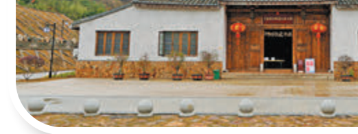
距離下草埔冶鐵遺址約100米的展示館，陳列分千年鐵場、冶煉手工、遠過重洋等5部分