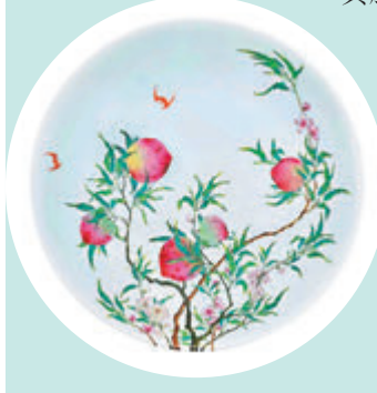
清雍正 粉彩過枝福壽雙全紋大盤 「大清雍正年製」款 估價：18,000,000 - 25,000,000 港幣

此場拍賣亦有一件雍正粉彩福壽雙全紋大盤，盤面桃花盛綻，果實累累，過牆而生。據仇國仕介紹這件大盤曾先後被岩崎男爵及芭芭拉·赫頓典藏，可謂來源出眾，「壽桃乃讓御窯藝匠發揮所長的絕佳題材，在嫩青與殷紅之間，變化微妙的粉彩調色活現了桃實之嬌嫩欲滴。雖然有數例傳世，但是每器繪畫都不盡相同。」