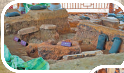
清晰可見的冶鐵爐遺址，有室內鍛爐、灰坑、儲水器等遺留。