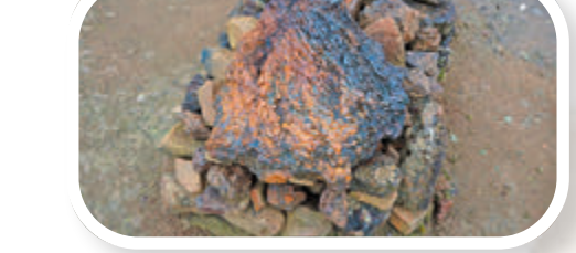
遺址前堆放着宋元時期冶鐵後的扇狀鐵渣。考古工作者正是發現這類鐵渣判定遺址所在區域存在冶鐵爐。