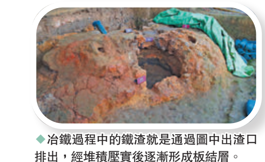
冶鐵過程中的鐵渣就是通過圖中出渣口排出，經堆積壓實後逐漸形成板結層。