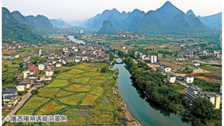
◆廣西陽朔遇龍河景色