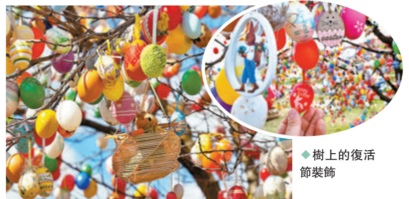
◆樹上的復活節裝飾