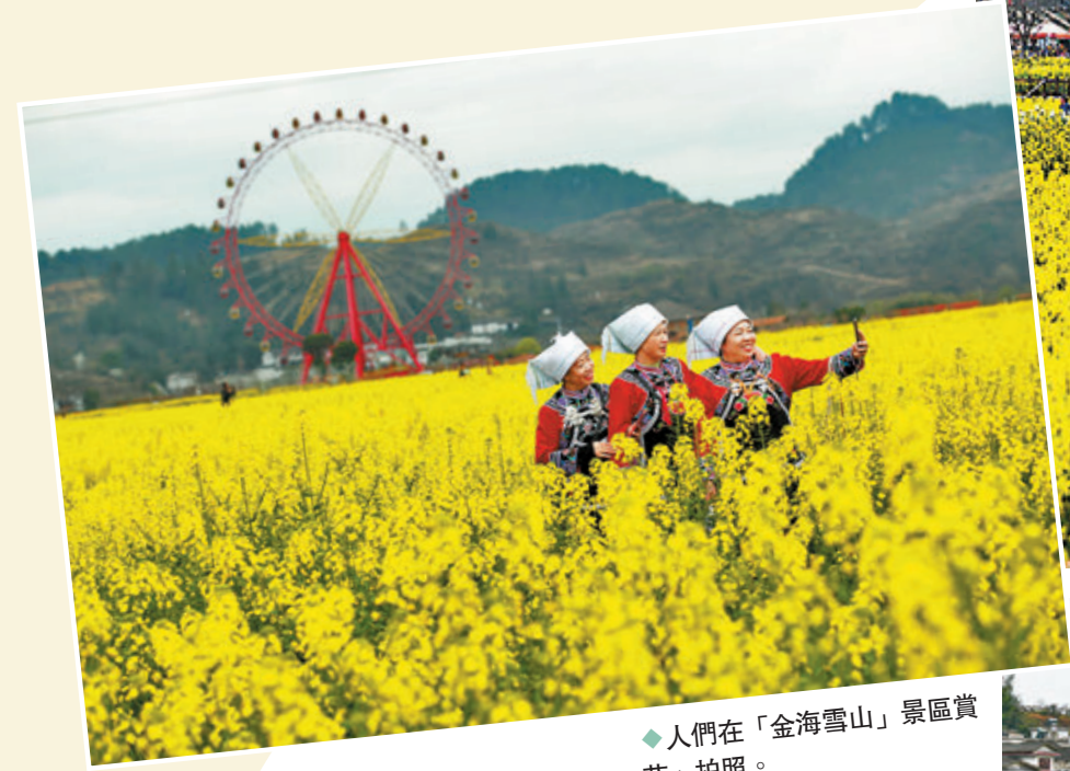
◆人們在「金海雪山」景區賞花、拍照。