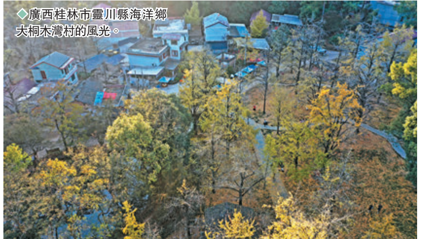
◆廣西桂林市靈川縣海洋鄉大桐木灣村的風光。