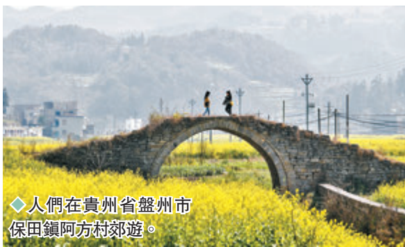
◆人們在貴州省盤州市保田鎮阿方村郊遊。