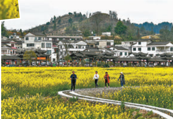
◆遊客在貴定縣盤江鎮「金海雪山」景區觀賞油菜花。