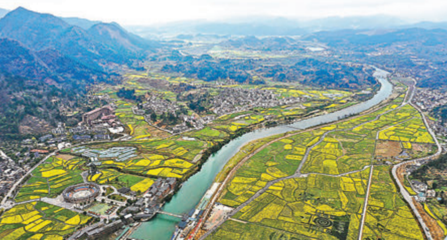
◆「金海雪山」景區的油菜花田