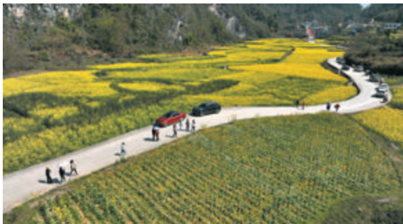
◆遊客在黔南布依族苗族自治州羅甸縣邊陽鎮油海村的油菜花海賞花、遊玩。