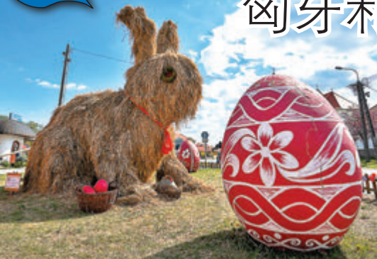
◆在匈牙利凱特海伊拍攝的復活節裝飾