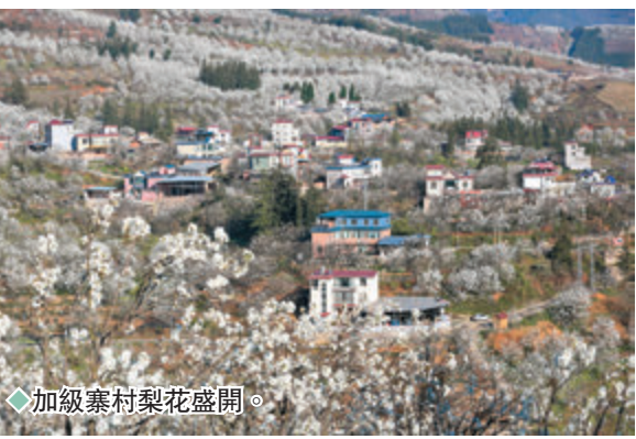
◆加級寨村梨花盛開。