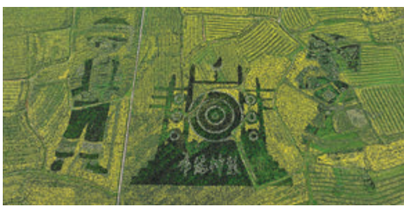
◆「金海雪山」景區的油菜花田