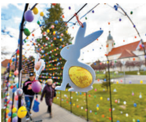
◆人們在凱特海伊觀看復活節裝飾