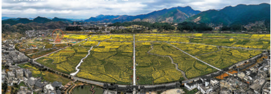
◆貴州省貴定縣盤江鎮的「金海雪山」

由於音寨家家戶戶都在自己的房前屋後山坡上種植李樹，每至春分，從音寨極目四望，遠山近巒，到處綻開雪白純潔的李花，這就是遠近聞名的盤江蘇李之花，恰與音寨河兩岸滿田滿壩盛開的金黃色油菜花形成鮮明對比，白色、黃色交相輝映，粉紅色的桃花點綴其間，翠綠色的樹叢襯托其底，布依山寨隱約其中，絢爛的色彩，旖旎的景致，華麗的氣質，萬畝油菜花和千頃梨花構織成了「金海雪山」之奇景。