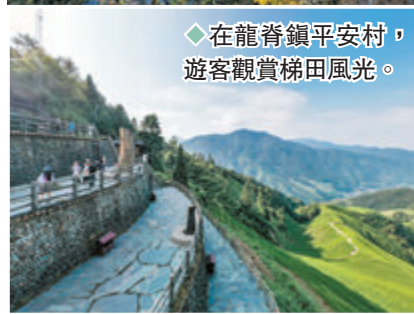
◆在龍脊鎮平安村，遊客觀賞梯田風光。