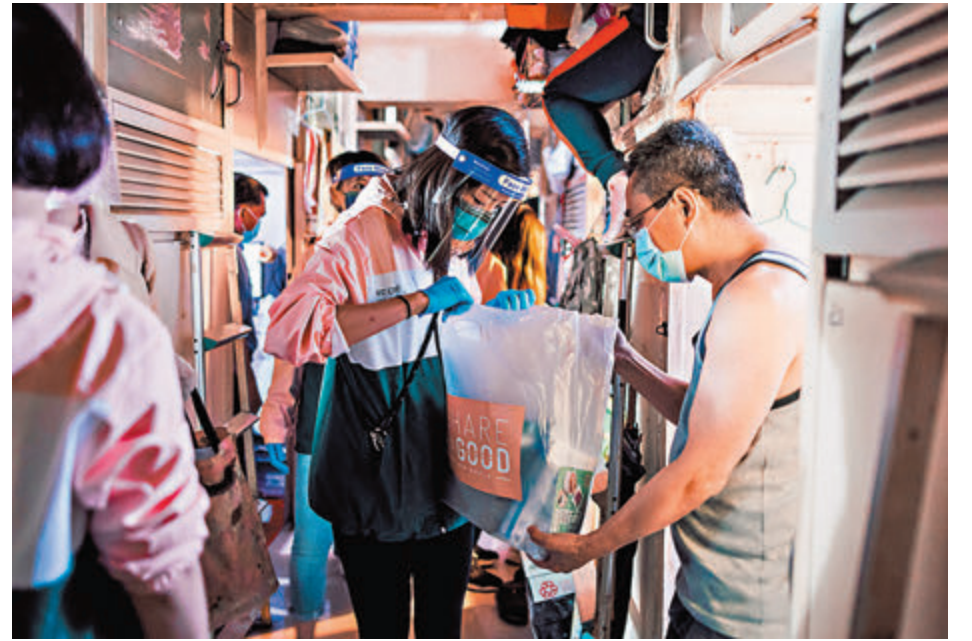
◆「愛互送」首階段逾10萬戶基層家庭受惠。

有關的網上課程適合小四至中三學生，配以Lenovo香港及香港電訊的捐贈，組成「寓教於樂」(Edutainment)的網上學習套裝，透過遊戲學習編程及更深入認識香港各區。「Share for Good 愛互送」其中3間受惠機構，包括兒童癌病基金、香港單親協會及陳校長免費補習天地將獲捐贈，約300名基層學童受惠。Microsoft香港亦正準備其他Microsoft Learn網上學習課程，免費提供予「Share for Good 愛互送」，預計1萬名學童受惠。此外，電子產品品牌ELECOM會捐出345個滑鼠，作為網上學習的配備。