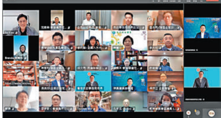
◆與會者籲為港青「搭好台、搭好梯」。

隨着全球一體化，多位領袖期望民政事務局能牽頭各局，跨部門訂定香港青年發展藍圖和定位，提供多元發展導向和實習交流平台，為港青「搭好台、搭好梯」。有領袖亦關注區議會檢討工作，期望當局加大地區專員的權力，以便做好跨部門協調安排，同時應多鼓勵基層婦女發