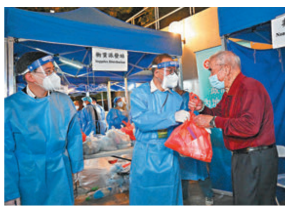
◆曾國衛派送防疫物資予受檢居民。

的職責為何，皆走上前線積極參與防疫工作。曾國衛、政制及內地事務局常任秘書長邵忍光、政制及內地事務局副局長胡健民和粵港澳大灣區發展專員袁民忠，聯同政制及內地事務局和選舉事務處的同事一同參與前日(13日)晚上在翠竹花園第十座展開的「圍封強檢」行動，安排受檢居民有序接受檢測，並向他們派送食物包、快速測試包及由中央人民政府捐贈的防疫中成藥等，支援他們在家防疫。