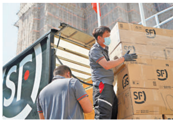
◆順豐香港提供物流派發支援。

此外，香港鑄造業議會向「全港防疫義工聯盟」、「全港社區防疫連線」捐贈27萬個FFP2口罩，物資已陸續派發到各社區予有需要人士。交接儀式昨日於「連線」秘書處舉行。