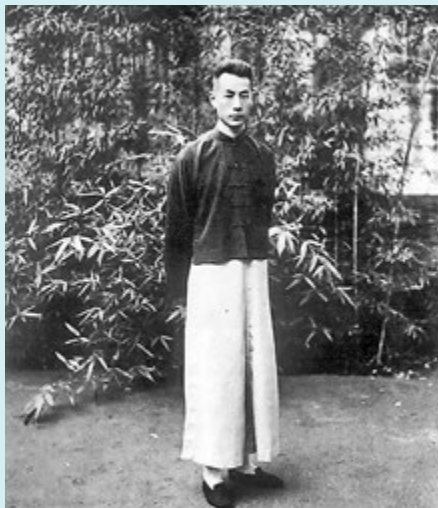
◆張伯駒被稱為「天下民間收藏第一人」。