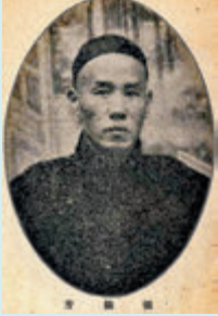
◆張伯駒嗣父、晚清最後一任直隸總督張鎮芳。

話，其一就是對於鹽業銀行史料的整理，如有評論家所說，《張伯駒年譜》裏有中國銀行業早期發展的一部簡史。其二是對於晚清最後一任直隸總督、張伯駒嗣父張鎮芳（張伯駒幼年過繼伯父張鎮芳為嗣子）事跡的整理，可以說，裏面套寫着一部《張鎮芳年譜》。