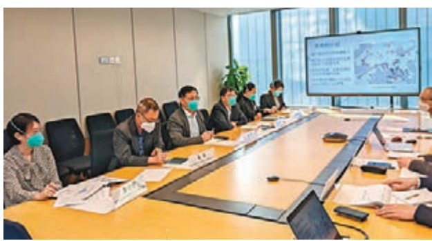
◆由關鵬(左三)率領的內地疫情防控專家組與環境保護署及渠務署就污水監測計劃進行技術交流及經驗分享會議。

專家團同時參觀了一個實地污水監測站，了解渠務署抽取污水樣本的過程，並到訪香港大學環境微生物組工程與生物技術實驗室，與工程學院張彤教授研討污水檢測技術。