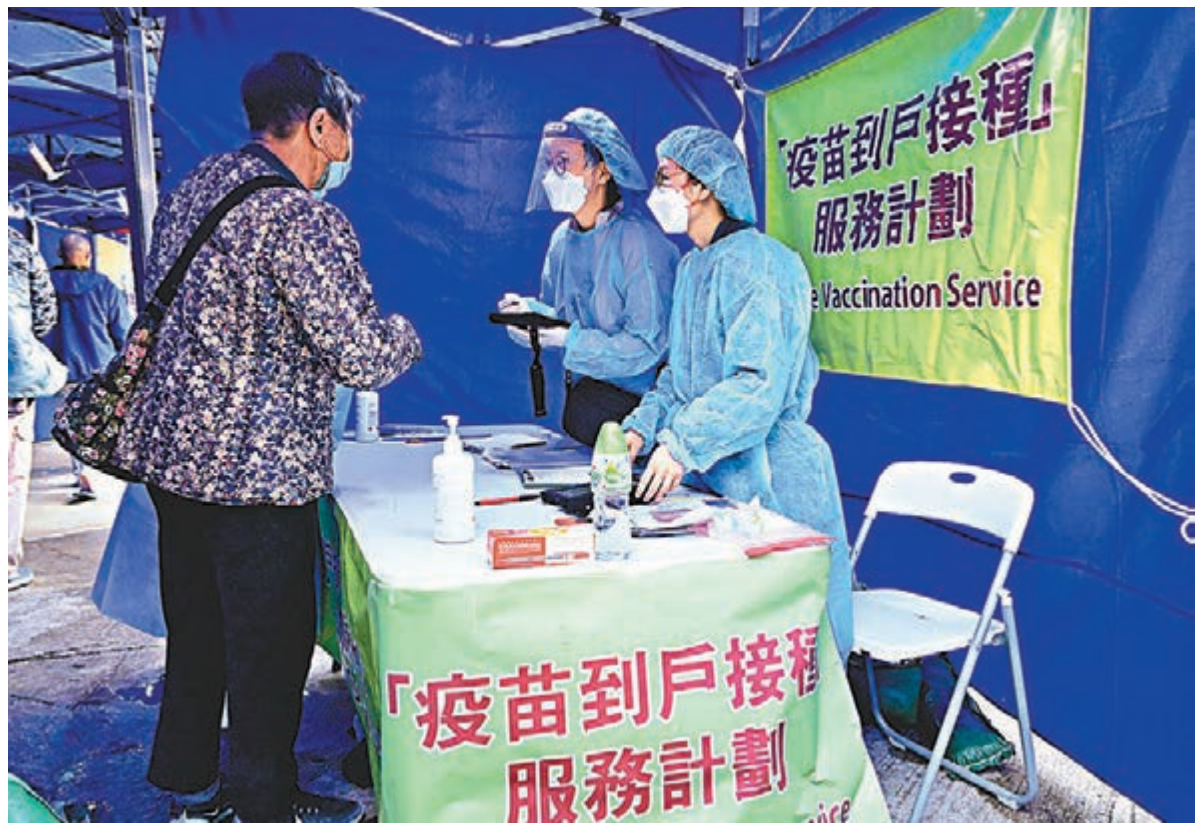
◆聶德權宣布，「疫苗到戶接種服務」下周二起接受市民登記。圖為公務員事務局早前設立的「疫苗到戶接種服務」諮詢站。

聶德權表示，自上月30日開始在「圍封強檢」的樓宇以試點形式提供到戶接種服務，截至本月14日已為13座樓宇合共50名人士完成上門接種疫苗，包括42名介乎70歲至98歲的長者。他表示，撇除已跟進的個案，特區政府亦收集約100個服務登記，社聯及香港醫學組織聯會亦有轉介約9,000個未完成接種的個案給政府處理。