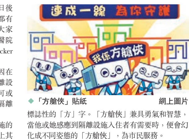
◆「方艙俠」貼紙 網上圖片

香港文匯報訊 「大家好！我係方艙俠，嘅日後方艙嘅活動同埋營內小區管理嘅通訊中，我都有機會同大家見面，用心為大家服務，亦希望大家繼續支持我嘅工作」。保安局為宣傳方艙醫院各項服務而設計的「方艙俠」WhatsApp Sticker（貼紙），在復活節閃亮登場。 保安局表示，設計「方艙俠」作宣傳，是在疫情下，要令確診人士安心入住六所社區隔離設施，除了有完善的硬件，人性化的軟件亦不可或缺。「方艙俠」的出現正好形象化地把社區隔離設施內工作人員提供的貼心服務介紹予公眾。 「方艙俠」人如其名，頭部正是社區隔離設施的房間外形，呈長方形，身披紅色斗篷，腰帶繫上其