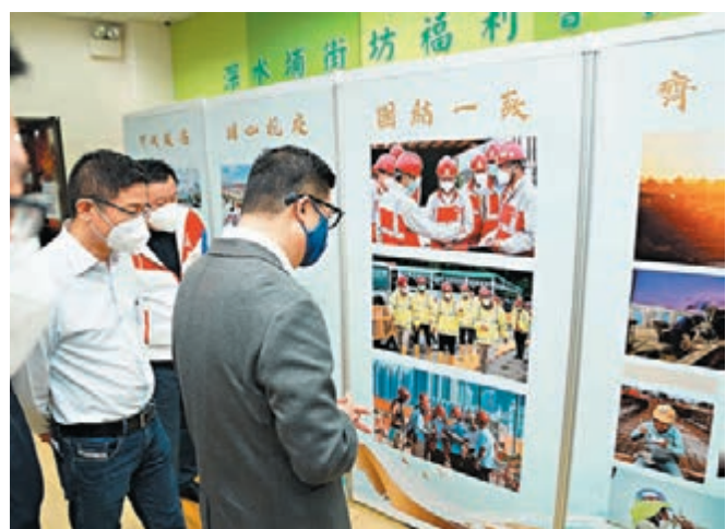
◆鄧炳強觀看中海愛心抗疫攝影展覽。