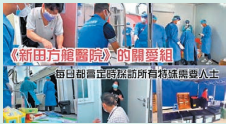
◆《有愛在隔離》宣傳片截圖。

香港文匯報訊 香港第五波疫情嚴峻，累計超過118萬人染疫，各紀律部隊積極參與抗疫。其中，由入境處全面管理3個社區隔離設施，包括青衣、新田和洪水橋社區隔離設施的日常運作。 繼早前發布《抗疫靠邊個？要靠你同我！》及《風雨下的社區隔離設施》的抗疫宣傳片後，入境處前日（15日）再發布最新宣傳片《有愛在隔離》，介紹其管理的新田方艙醫院情況。 片中可見，入境處關愛小組組員化身「天使」，定期親身探訪及補充物資予特殊需要人士，採取靈活變通的方法，包括以手語翻譯、「寫紙仔」等方式了解正在隔離的聽障人士所需，並提供24小時運作的WhatsApp支援服務。在疫情下，為隔離人士送上點點愛意。 同時，片中還載有關愛小組給有需要家庭送上BB浴盆的小插曲。 據了解，3個社區隔離設施合共有超過2,300個房間供隔離人士使用，可容納接近8,000多人。入境處有超過900名人員在隔離設施輪班工作，24小時為入住的市民服務。