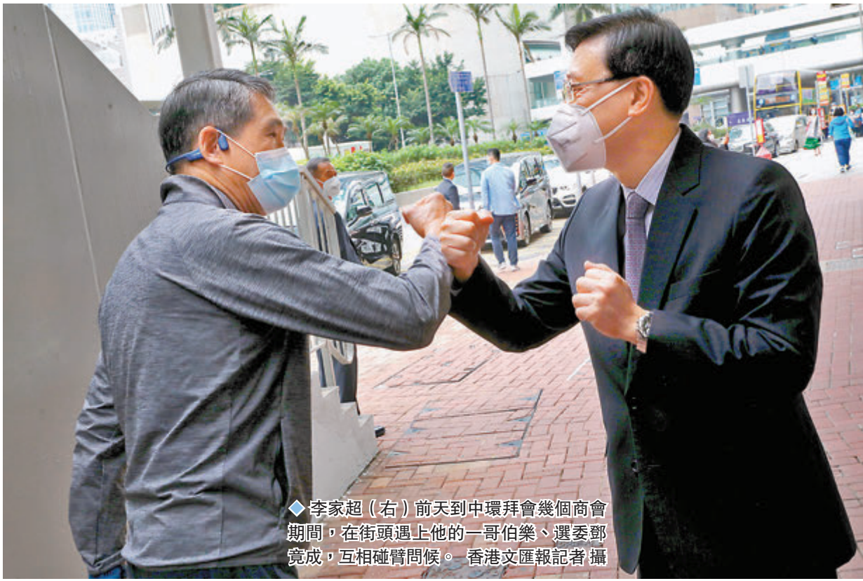
◆李家超(右)前天到中環拜會幾個商會期間，在街頭遇上他的一哥伯樂、選委鄧竟成，互相碰拳問候。

在一個多小時的交流會上，李家超先闡述自己未來施政的三個主要方向，其後19位代表及委員相繼發言，就不同方面提出具體建議和觀點(見表)。