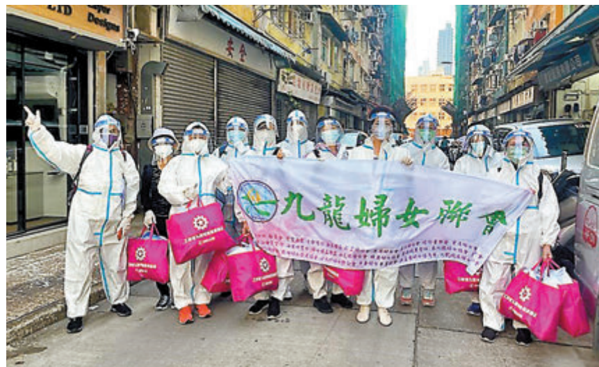
◆九龍婦女聯會抗疫連線愛心義工隊已發展至312位義工，出動服務多達603人次。