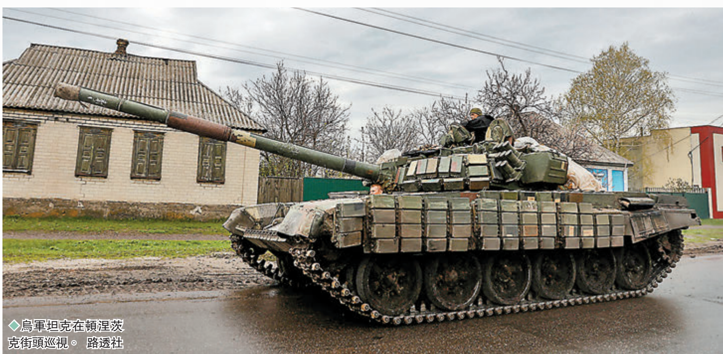
◆烏軍坦克在頓涅茨克街頭巡視。