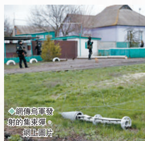
◆網傳烏軍發射的集束彈。網止圖片