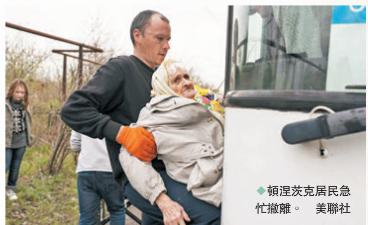
◆頓涅茨克居民急忙撤離。