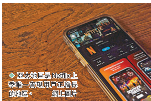
◆亞太地區是Netflix上季唯一實現用戶正增長的地區。

Netflix在首季業績報告中，提到未來將加強北美市場以外的本土化內容製作，事實上，Netflix在報告中提到的6部平台最受歡迎影視作品中，就有3部是海外劇集，分別是去年大熱的韓劇《魷魚遊戲》、《羅蘭校園》和西班牙劇集《紙房子》，而亞太地區更是