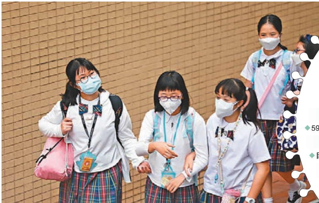
◆昨日6間學校呈報有陽性個案，專家指學校有個案是預料中，只要沒出現集體傳播無需停課。圖為聖保祿小學學生放學。香港文匯報記者 攝

包括5位教職員，來自4間學校，及兩位來自兩間學校的學生，7名師生昨日均居家隔離沒有去學校，惟當中5人前日曾回校。歐家榮說，社會有廣泛傳播，學校有散發個案是預料中，只要沒出現集體傳播無需停課，中心會密切監察校內傳播風險。