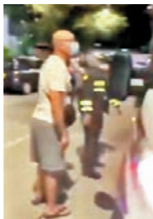
◆有惡霸站在警車前指罵警員。

警方昨日指，海麗街一帶違例泊車嚴重，包括今年2月16日深水埗警區接獲附近的瑪利諾神父教會學校、聖公會聖安德烈小學和聖公會聖馬利亞堂莫慶中學的校長投訴，指海麗街於晚上及早上9時的車輛違泊情況嚴重，阻礙校車出入及家長接