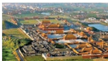
◆橫店影視城的外貌。

影視文化產業為展現可信、可愛、可敬的中國形象作出重要貢獻，位於浙江橫店是其中一個典型代表。北京電影學院黨委副書記、副校長胡智鋒，以及浙江省橫店影視產業文學藝術界聯合會主席徐天福近日接受中新社「東西問」專訪。兩人談及到新時代中國影視文化產業的特點，並通過比較橫店與荷里活、寶萊塢的異同，探討中國影視文化產業如何與世界交流互鑒？胡智鋒說主要呈現以下特點：一是政策紅利不斷見效，國家高度重視文化強國，在稅收、人才等多方面給予影視文化產業大量切實扶持；二是電影市場活躍，在春節檔、國慶檔等關鍵檔期，中國電影常出現數十億元人民幣的高票房影片，有的在全球票房中都名列前茅；三是教育功能不斷強化，《覺醒時代》、《我和我的祖國》等影視作品在塑造年輕人的人生觀、價值觀、世界觀方面起到積極作用；四是國際傳播功能不斷凸顯；五是影視技術不斷發展；六是產業帶動作用不斷體現。