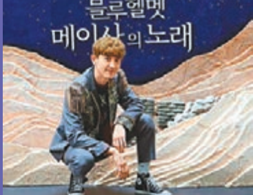
▲EXO 朴燦烈是一位多才多藝的歌手。