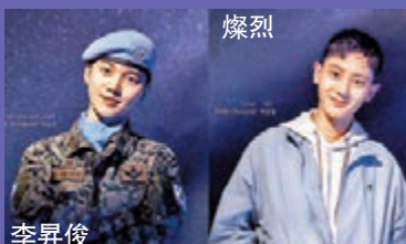
◆4人在音樂劇中各展魅力。