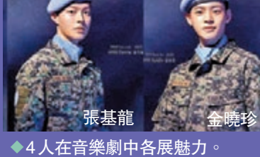
◆4人在音樂劇中各展魅力。