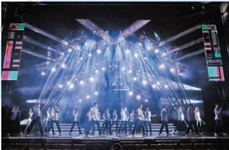
◆《BLUE HELMET：A SONG OF MEISSA》香港與韓國同步直播。

EXO很多成員包括隊長SUHO和D.O.（都敬秀）也有參與電影的演出，燦烈算是最早出演電影的EXO成員，早於2015年已經與朴根滢、尹汝貞、趙震雄、韓志旼、文佳煥等合演《無事忘家族》，縱使在電影中只飾演脾氣暴躁脾實則患上腦退化症爺爺的孫兒，但整部電影很發人深省，看完無不熱淚盈眶。其後亦陸續參與電影的演出，包括《鄰家美男團》（EXO NEXT DOOR），與少女時代成員徐玄主演的2016年電影《所以……和黑粉結婚了》，當時在中國內地上映時，僅一天票房已破2,000萬元人民幣；在2020年8月開拍的電影《The Box》中，燦烈飾演一個有着天籟之音、抱着要成為歌手卻有「觸目恐懼症」的年輕人志訓，遇上了一個潦倒前音樂監製，幫助志訓去克服困難重拾自信，而《The Box》剛在3月24日上映。燦烈是EXO成員中截至目前為