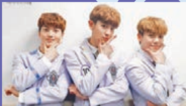
◆音樂劇《BLUE HELMET：A SONG OF MEISSA》劇照。