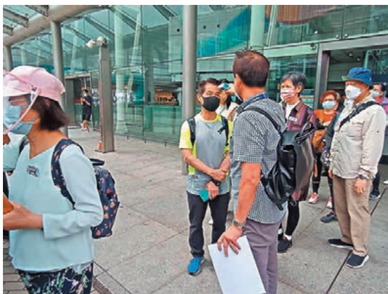
◆導遊在出發前為團友們量度體溫。

香港文匯報訊（記者 高俊威）首階段放寬社交距離措施，容許不超過30人的本地遊復辦，昨日有首個本地遊旅行團出發。主辦該團的旅行社表示，今次復辦本地遊的反應未如以往熱烈，首星期的報名人數比前減少40%，相信與港人困在香港逾兩年未能外遊、早已遊覽過本港多處景點有關，但截至下月底仍會有近40團成行。由於現階段本地遊放寬至每團上限100人的條件是所有旅客均需通過快測，絕大部分旅行社目前均採取較謹慎的策略，只辦最多30人的團。香港旅遊業議會表示，截至前日下午4時，共接獲約200間旅行社提交本地遊的豁免申請，當中約150間的申請已獲審批，大約40間旅行社共登記約200個新行程。旅議會估計，今日出團數目不會太多，只有單位數字，全部不超過30人上限。