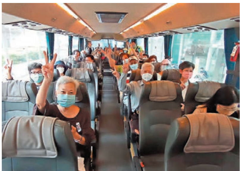
◆有團友表示，疫情期間已多次參加本地遊，因四處遊覽可放鬆心情，人會更開心。

特區政府早前公布容許恢復不超過30人的本地遊，規定員工必須接種三劑疫苗，並在出團前進行快速測試，遊客則需滿足「疫苗通行證」的要求，但毋須進行快測。縱橫遊旅行社昨日舉辦防疫措施放寬後首個本地遊旅行團，有28名團