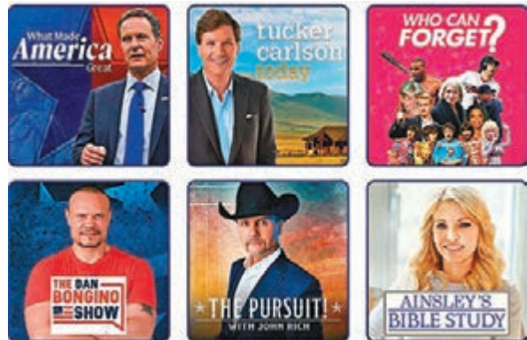
◆Fox Nation成功將新聞分析與娛樂節目結合。