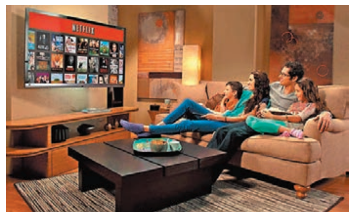
◆Netflix付費用戶數目首度減少。