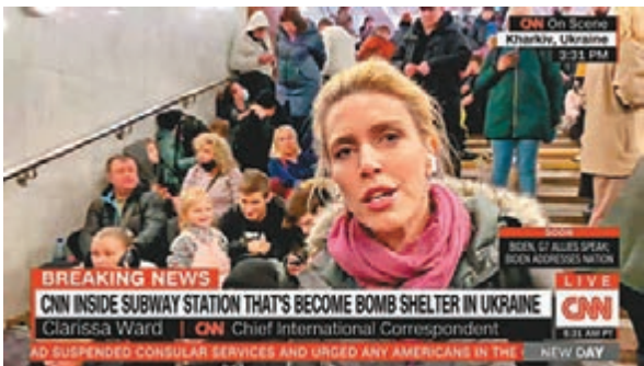
◆CNN招牌業務是全天候突發新聞報道。