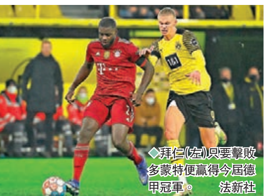
◆拜仁(左)只要擊敗多蒙特便贏得今屆德甲冠軍。法新社

同日法甲「一哥」巴黎聖日耳門（PSG）主場對朗斯（now639台周日3:00a.m.直播）。數字上PSG只要多取1分即可稱王，朗斯相信難阻主隊奪標。