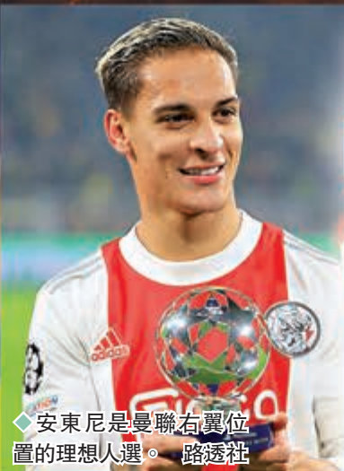
◆安東尼是曼聯右翼位置的理想人選。