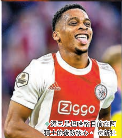
◆添巴是坦哈格目前在阿積士的後防核心。