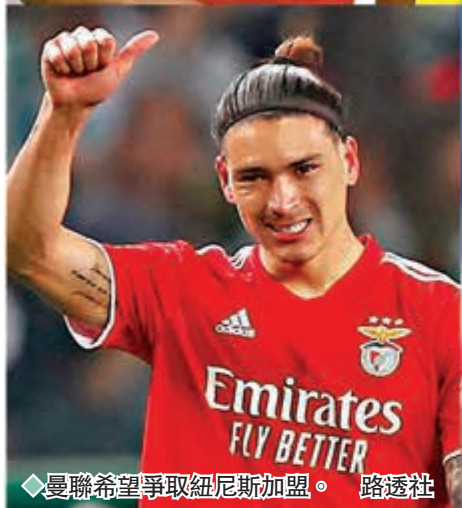
◆曼聯希望爭取紐尼士加盟。