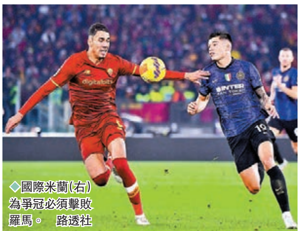
◆國際米蘭(右)為爭冠必須擊敗羅馬。

香港文匯報訊（記者楊浩然）意甲於香港時間周日凌晨上演前哨大戰，由「二哥」國際米蘭主場對第5位的羅馬。以兩軍近況看來是役必有一番惡鬥，但有主場之利的「國米」該可看高一線。（now638台周日0:00a.m.直播）