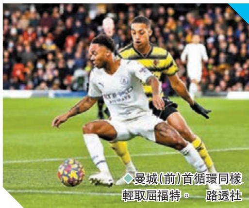
◆曼城(前)首循環同樣輕取屈福特。