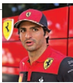
◆辛斯留效法拉利至2024年。

一級方程式車隊法拉利日前宣布，和陣中西班牙車手辛斯續約至2024年。去年才加盟法拉利的辛斯至今表現穩定，這位27歲車手在續約後表示：「我一直說沒有比法拉利更好的F1車隊，和大家共事一年之後，我可以確信穿上這套賽車服代表這支車隊參賽是獨一無二的。」