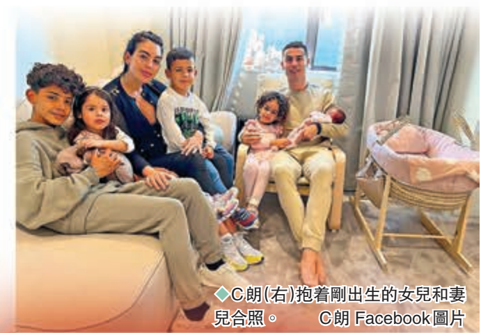
◆C朗(右)抱着剛出生的女兒和妻兒合照。

相比起阿仙奴的谷底反彈，曼聯上場對利物浦卻是遭逢大敗，士氣此消彼長下形勢相當嚴峻。至於早前經歷喪子之痛的C朗拿度已經歸隊復操，今場可以候命，並在個人社交平台上載自己抱著初生女兒和妻兒合照的照片，看來心情已稍為平伏；另一方面，一眾球員現時亦需要在來季新帥坦哈格到來前證明自己，且看這傳統勁旅能否走出陰霾，重新獲得球迷的信任。