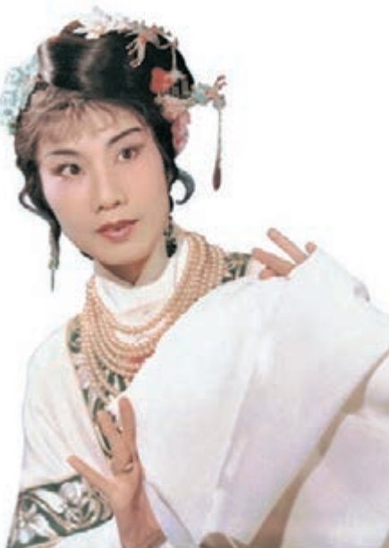
袁雪芬1960年《西廂記》的造型。

◆紀念袁雪芬誕辰100周年暨致敬越劇改革80周年活動，在浙江省紹興市嵊州市開幕。