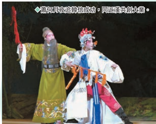
蕭何夜夜追韓信成功，同返漢共創大業。